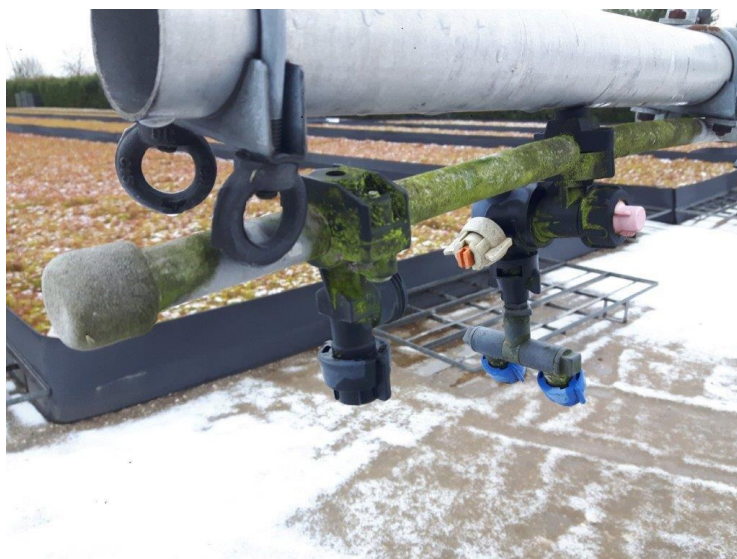
Zdj. 1 – instalacja rozlewowa na rampach – stan obecny