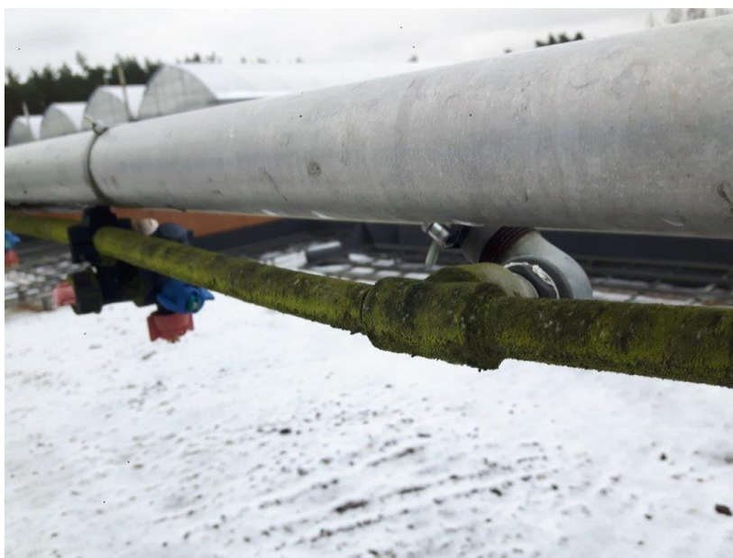
Zdj. 3 – instalacja rozlewowa – stan obecny