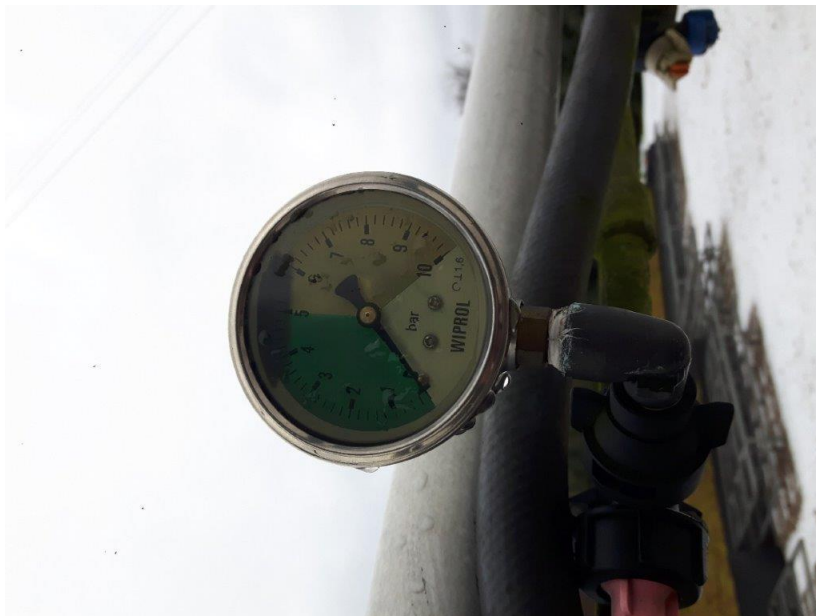
Zdj. 10 – manometr – stan obecny