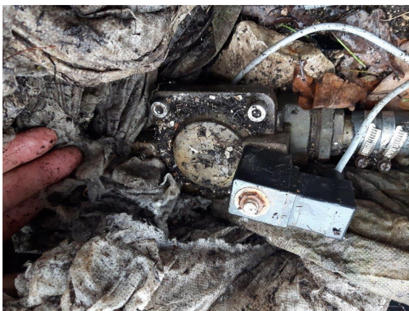
Zdj. 12 – elektrozawór – stan obecny