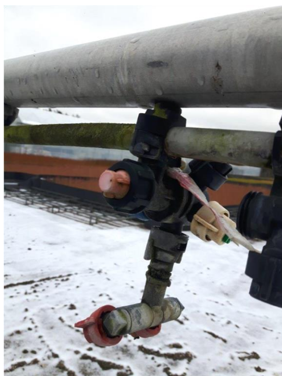
Zdj. 2 – głowice rozlewowe – stan obecny