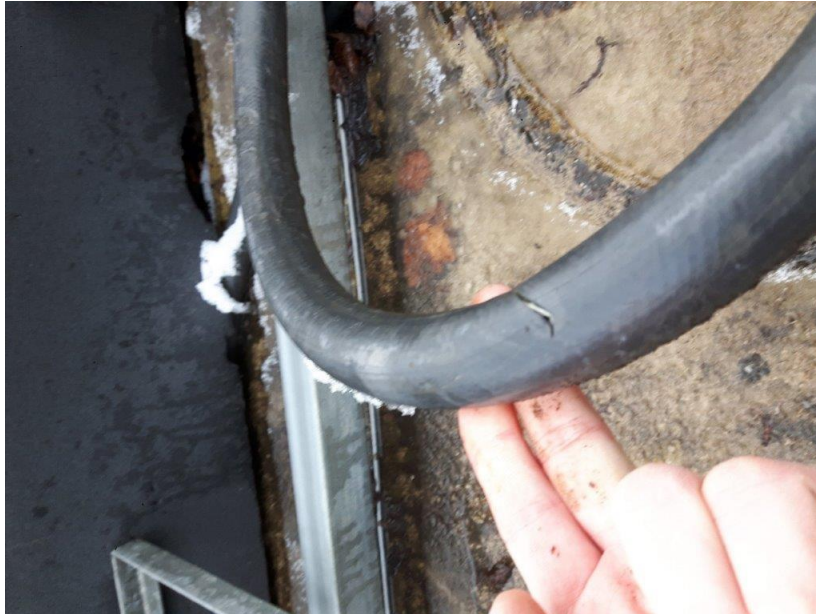
Zdj. 7 – przewody doprowadzające ciecż – stan obecny