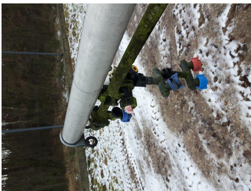
Zdj. 6 - głowice rozlewowe – stan obecny