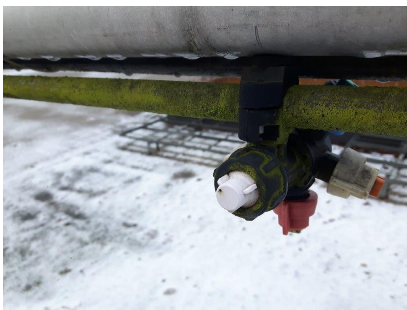
Zdj. 4 – głowice rozlewowe – stan obecny