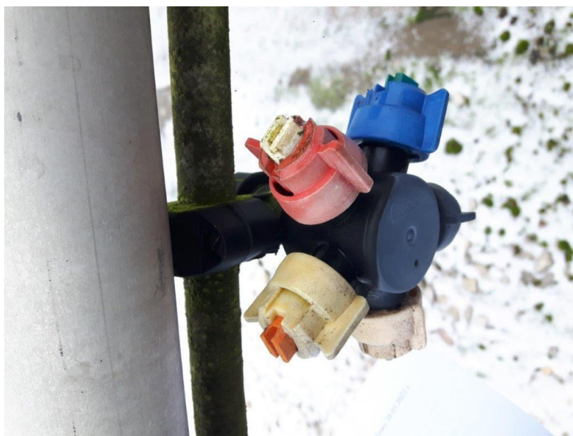
Zdj. 5 – głowice rozlewowe – stan obecny