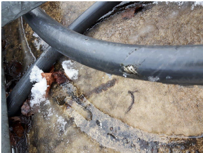
Zdj. 8 – przewody doprowadzające ciecż – stan obecny