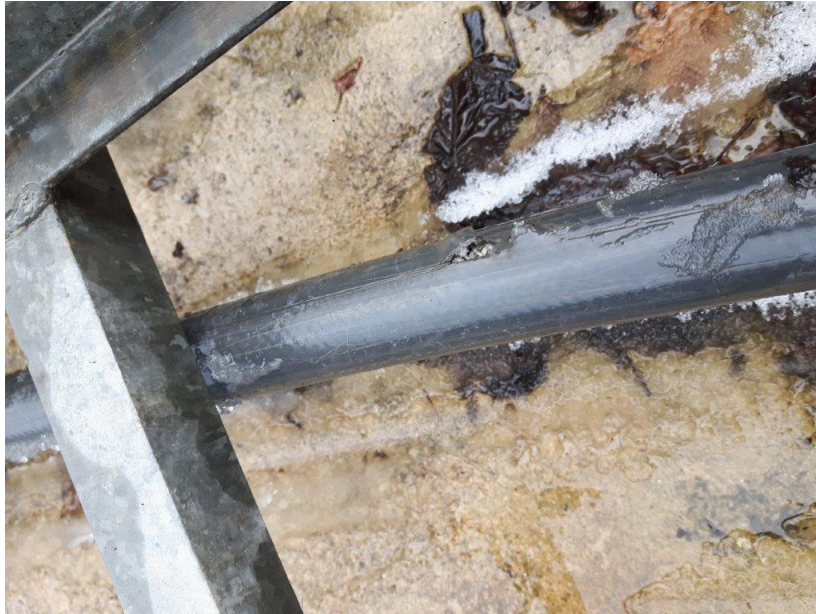
Zdj. 9 – przewody doprowadzające ciecż – stan obecny