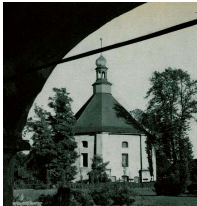
Fot. Kaplica przed II Wojną Światową. Widok od strony krużganków cmentarza

J. Schwela, Sorau N.-L. und Umgebung in Wort und Bild , Chemnitz 1908.