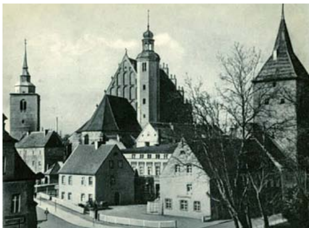
Fot. Okolice obecnej Szkoły Muzycznej – stan przed II Wojną Światową

Budynek, w którym znajduje się Szkoła Muzyczna powstał pod koniec XIX wieku. Otwarto w nim Wyższą Szkołę Żeńską (niem. Höhere Töchterschule). Nie były to jednak studia wyższe w obecnym rozumieniu, bowiem poziom placówki odpowiadał niepełnej szkole średniej bez uprawnień do matury.