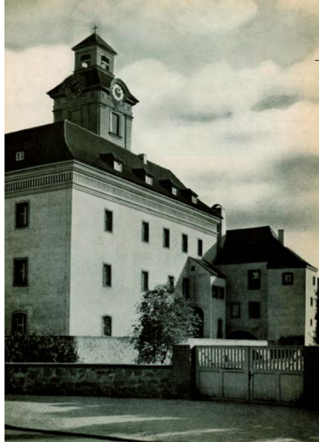
Fot. Zamek rodzin von Dewin i von Pack, przed II Wojną Światową

Przebywający w Żarach od 1704 do 1706 roku Georg Philipp Telemann, który jest patronem tutejszej Szkoły Muzycznej, pełnił funkcję kapelmistrza na dworze Promnitzów. Był jednym z najwybitniejszych muzyków i kompozytorów baroku. Urodził się w Magdeburgu w 1681 roku, a zmarł w Hamburgu w 1767 roku. Miasto zawdzięczało