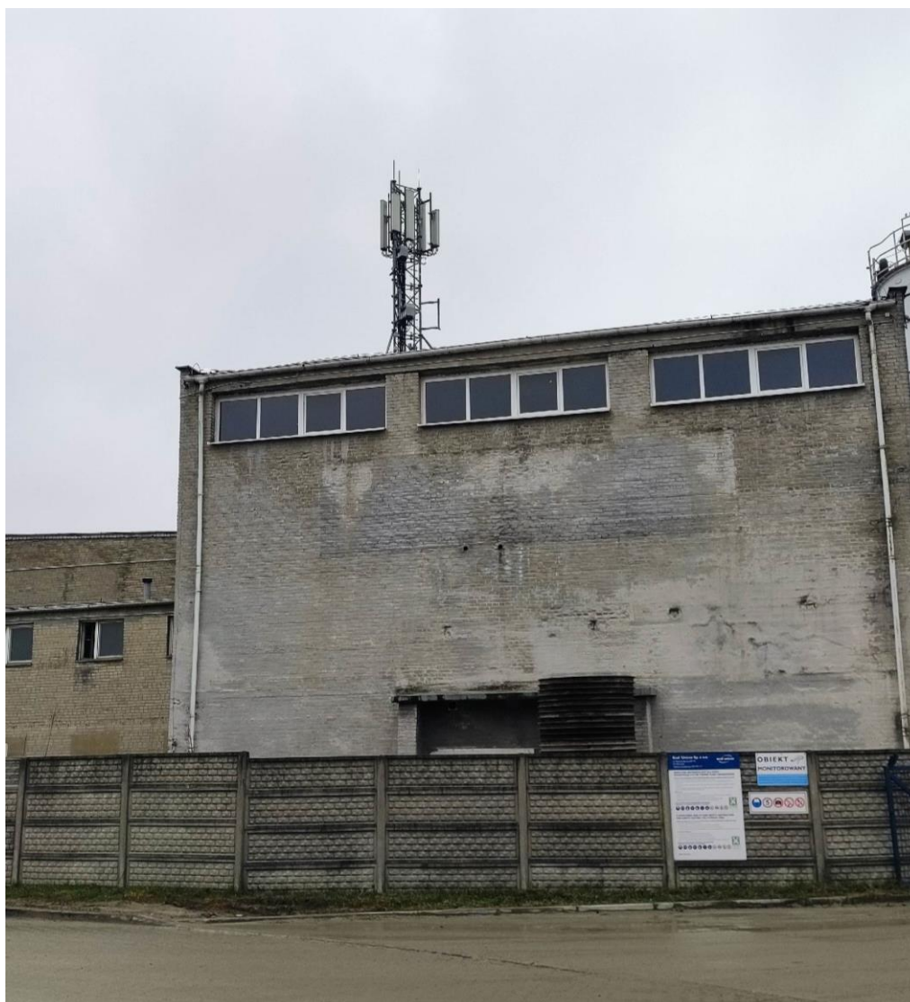
Fot. 1: Widok anten stacji bazowej: ID: 90427, zlokalizowanej: ul. Demokratyczna 89/93, Łódź