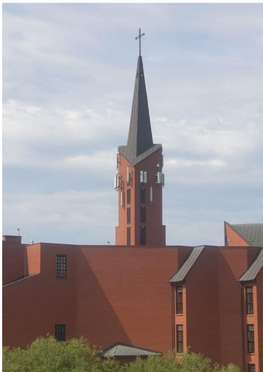
Fot. 1: Widok anten stacji bazowych ID: BT44731, GDA0080_A, 40042N!, zlokalizowanych pod adresem: ul. Cieszyńskiego 1, 80-809 Gdańsk