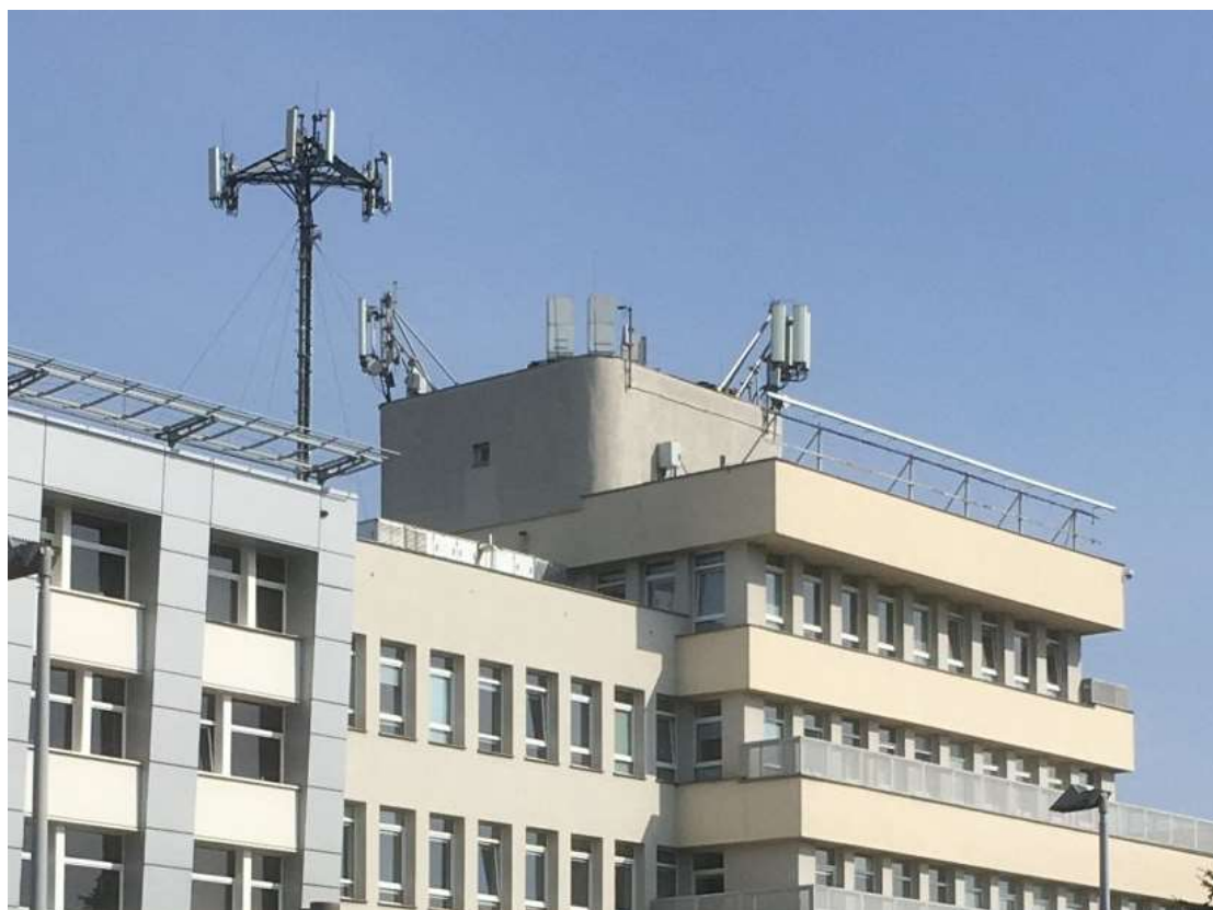
Fot. 1: Widoki anten stacji bazowych ID: GDA0029 oraz ID: 30004, zlokalizowanych: ul. Biała 1 / ul. Zawiszy Czarnego 18, Gdańsk