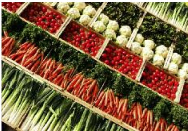
Polska poparła przedłużenie funkcjonowania o jeden rok nadzwyczajnego mechanizmu wsparcia dla rynku owoców i warzyw