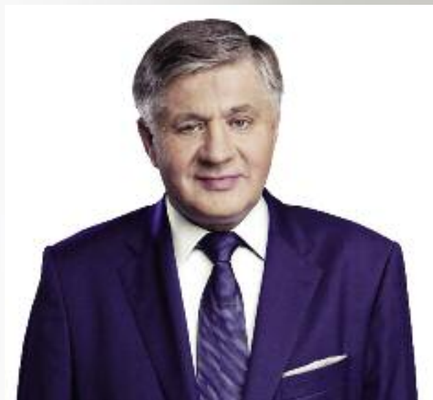
Krzysztof Jurgiel, minister rolnictwa i rozwoju wsi