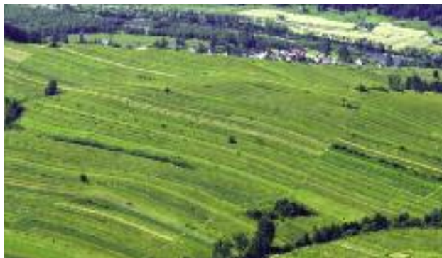
WPR powinna zapewniać równe warunki konkurencji na jednolitym rynku, co wymaga wyrównania wsparcia bezpośredniego

zarządzeniem Ministra Rolnictwa i Rozwoju Wsi, powołano Zespół wspierający prace w zakresie przeglądu Wspólnej Polityki Rolnej w latach 2014-2020 i opracowania propozycji Polski dotyczących tej polityki po roku 2020 . W wyniku prac określono elementy polskiej wizji WPR, która powinna: