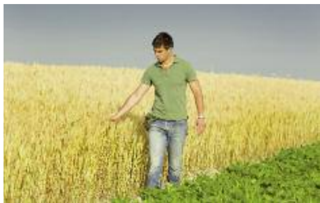
Zmiany w dopłatach do ubezpieczeń upraw rolnych mają zapewnić upowszechnienie sprzedaży pakietowych umów ubezpieczenia

o ubezpieczeniach upraw rolnych i zwierząt gospodarskich wprowadzono preferencje dla pakietowego ubezpieczenia upraw i zwierząt od skutków niekorzystnych zjawisk atmosferycznych. Zmiana ta ma zapewnić upowszechnienie sprzedaży pakietowych umów ubezpieczenia upraw rolnych i w efekcie zabezpieczyć producentów rolnych od strat spowodowanych przez ich wystąpienie. Dopłaty do składek ubezpieczenia będą przysługiwały producentom rolnym w wysokości 65% składki z tytułu ubezpieczenia upraw do stawki taryfowej pakietu ubezpieczenia upraw nie przekraczającej 9% sumy ubezpieczenia. Wprowadzenie powyższego przepisu ma na celu zwiększenie ochrony ubezpieczeniowej upraw rolnych, a tym samym zmniejszenie ryzyka produkcji.