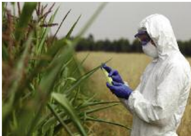
W marcu br. KE wyraziła zgodę na wyłączenie całego terytorium Polski spod upraw kukurydzy MON

W dniu 18 kwietnia br. zostało przyjęte rozporządzenie Rady Ministrów (Dz. U. poz. 582), w którym została zaktualizowana lista odmian kukurydzy MON 810, których materiał siewny jest zakazany do stosowania w Polsce. Nowelizacja rozporządzenia była konieczna ze względu na zmiany we wspólnym katalogu odmian roślin rolniczych oraz rejestrów państw członkowskich UE. Dzięki nowelizacji doprowadzono do zgodności i uaktualnienia