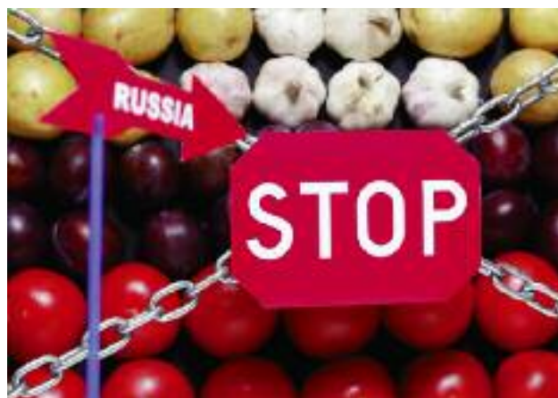
Polska popiera działania ukierunkowane na zniesienie barier fitosanitarnych i stoi na stanowisku, że konieczne jest zachowanie jednolitego podejścia do całego rynku unijnego, zwłaszcza w negocjacjach z Rosją

● Dalsze działania ukierunkowane na zniesienie barier fitosanitarnych (Rosja) – Polska popiera podjęcie powyższych działań. Jednocześnie należy zachować jednolite podejście do całego unijnego rynku, zwłaszcza w negocjacjach z Federacją Rosyjską.