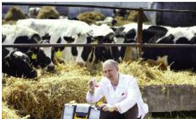
Zgodnie z wymaganiami obowiązującymi w krajach UE również w Polsce prowadzony jest regularny monitoring BSE

Od 2006 r. cyklicznie co roku wprowadzany jest program zwalczania BSE obejmujący monitorowanie tej jednostki chorobowej, którego celem jest wykrycie każdego przypadku BSE w populacji bydła w Polsce. Ponadto, realizacja tego programu pozwala również na podwyższanie wieku badanego bydła w kierunku BSE poddawanego ubojowi.