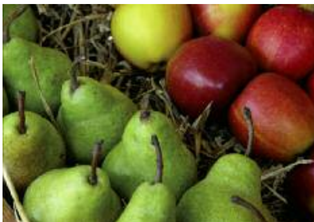
W ramach kolejnej, piątej transzy tymczasowego, nadzwyczajnego wsparcia dla producentów owoców i warzyw mielibyśmy możliwość objęcia rekompensatami łącznie ok. 100 tys. ton owoców, z czego 90 tys. ton jabłek i gruszek

Do tej pory KE uruchomiła cztery transze tymczasowego, nadzwyczajnego wsparcia dla producentów owoców i warzyw. Obecnie funkcjonujący mechanizm umożliwia realizację działań mających na celu redukcję podaży owoców i warzyw w terminie do 30 czerwca br. Zważywszy, że embargo wprowadzone przez władze Federacji Rosyjskiej ma obowiązywać przynajmniej do sierpnia 2016 r. Polska wnioskowała o kontynuację nadzwyczajnego mechanizmu wsparcia.