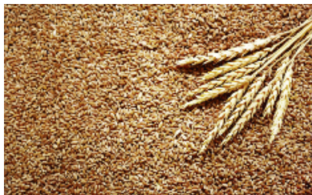
Polska jest przeciwna przyznawaniu preferencji w imporcie ziarna zbóż na rynek UE

Posiedzenia Komitetu ds. WORR dotyczyły istotnych dla naszego kraju kwestii m.in. importu zbóż z Ukrainy, konieczności traktowania cukru i wyrobów o jego dużej zawartości jako produktów wrażliwych, prognoz kształtowania się sytuacji na rynku. W styczniu br. podjęto decyzję o uruchomieniu II transzy wywozu cukru pozakwotowego z UE, mając na uwadze stabilizację sytuacji na rynku cukru i zapewnienie producentom możliwości zaspodarowania nadwyżek produkcyjnych. Ponadto