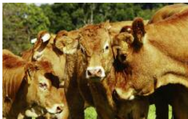
Rozwój produkcji bydła mięsnego to jeden z czterech rodzajów inwestycji objętych wsparciem w ramach działania „Modernizacja gospodarstw rolnych” PROW 2014-2020

si doprowadzić do wzrostu wartości dodanej brutto w gospodarstwie (GVA), w szczególności w wyniku racjonalizacji technologii produkcji lub wprowadzenia innowacji, zmiany profilu lub skali produkcji, poprawy jakości produkcji lub zwiększenia wartości dodanej produktu, co najmniej o 10% w odniesieniu do roku bazowego w okresie 5 lat od dnia przyznania pomocy.