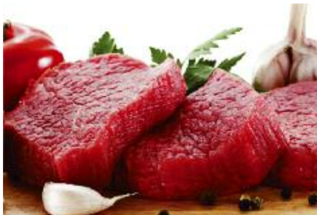
Bardzo istotne jest utrzymanie konkurencyjności w eksporcie wołowiny oraz zdobywanie nowych rynków zbytu i zwiększenie spożycia mięsa wołowego w kraju

Podobnie jak w przypadku mięsa drobiowego, Polska jest eksporterem netto także w sektorze wołowiny, dlatego bardzo istotne jest utrzymanie konkurencyjności w eksporcie, poszukiwanie nowych rynków zbytu, a także zwiększanie spożycia wołowiny w Polsce.