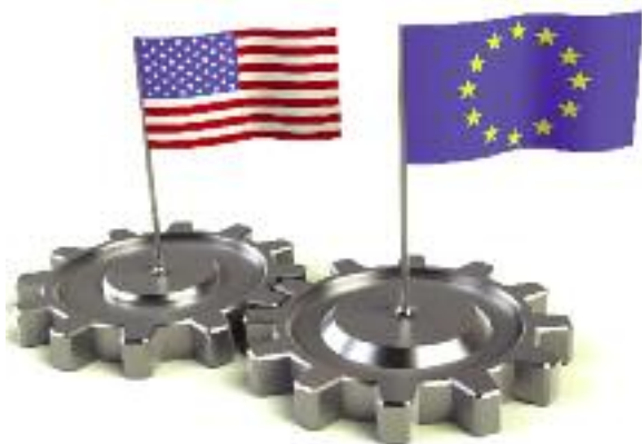
MRiRW brało aktywny udział w wypracowaniu stanowiska polskiego Rządu w negocjacjach umowy handlowej USA-UE

wych z krajami trzecimi, wraz z propozycją wniosków do rozważenia przez Rząd (luty br.). W związku z tym, Ministerstwo Rozwoju zostało zobowiązane przez KSE do opracowania kompleksowego materiału nt. negocjacji handlowych, z uwzględnieniem wniosków MRiRW. Prace wciąż trwają;