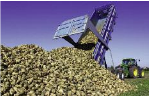
MRiRW dzięki zainicjowaniu rozmów pomiędzy przedstawicielami plantatorów buraków cukrowych i przemysłu cukrowniczego doprowadziło do podjęcia pracy nad utworzeniem Ogólnopolskiego Porozumienia Branżowego

● wprowadzenia obowiązku podpisywania umów na dostawę produktów rolnych – rozwiązanie to pozwala producentom na lepsze planowanie produkcji i dostosowanie jej do zapotrzebowania. Stosowanie umów ma na celu poprawę koordynacji i planowania działań w ramach łańcucha marketingowego, optymalizację kosztów produkcji, wzmocnienie pozycji producentów rolnych, ograniczanie nieuczciwych praktyk handlowych, uporządkowanie relacji między producentami a przetwórcami i handlowcami;