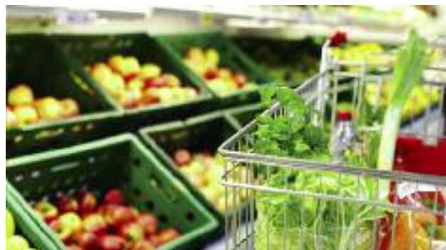
MRiRW prezentuje stanowisko, że większość surowców i wyrobów, w tym mleko, mięso, warzywa i owoce, należy wyłączyć z liberalizacji handlu

Zgodnie z art. 10 ust. 1 ustawy z dnia 21 grudnia 2000 r. o jakości handlowej artykułów rolno-spożywczych (Dz. U. z 2015 r. poz. 678 z późn. zm.) artykuły rolno-spożywcze przywożone z państw niebędących członkami Unii Europejskiej, z wyłączeniem państw członkowskich Europejskiego Porozumienia o Wolnym Handlu (EFTA) – stron umowy