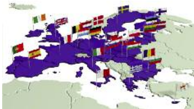
Przedstawiciele kierownictwa resortu rolnictwa aktywnie uczestniczyli we współpracy bilateralnej i wielostronnej z państwami UE

sku dotyczącego zmodyfikowania zasad realizacji planowanego mechanizmu wsparcia dla producentów owoców i warzyw. Obaj ministrowie zgodzili się, że bardzo ważne znaczenie dla sytuacji rolników w UE będzie miała dyskusja dotycząca przeglądu obecnej Wspólnej Polityki Rolnej oraz jej kształtu po roku 2020, w kontekście planowanego przeglądu Wieloletnich Ram Finansowych. Obaj ministrowie wyrazili wolę kontynuowania współpracy również w formule Trójkąta Weimarskiego.