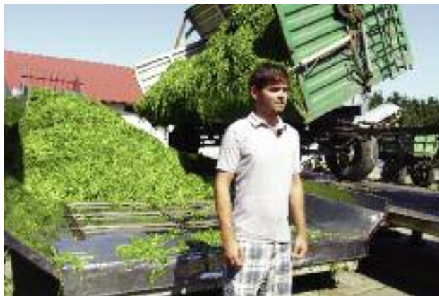
Osoby po raz pierwszy podejmujące się prowadzenia gospodarstwa rolnego mogą skorzystać z premii w wysokości 100 tys. zł

Pomoc w formie premii w wysokości 100 tys. zł jest kierowana do osób, które w chwili składania wniosku o przyznanie pomocy mają nie więcej niż 40 lat, posiadają odpowiednie kwalifikacje zawodowe i po raz pierwszy rozpoczynają działalność w gospodarstwie rolnym jako kierujący tym gospodarstwem.