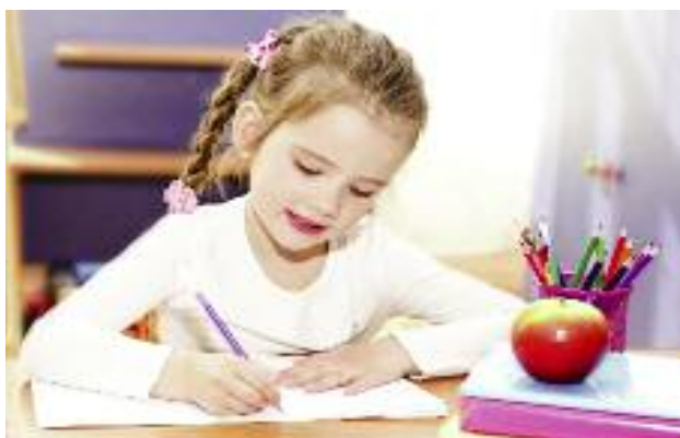
Aktualny stan wydatków w ramach programu „Owoce i warzywa w szkole” był tematem marcowego spotkania Komitetu ds. Wspólnej Organizacji Rynków Rolnych

Innymi tematami posiedzeń były przepisy dotyczące programu Owoce i warzywa w szkole oraz aktualny stan wydatków w ramach tego programu. Podczas spotkania Komitetu w dniu 15 marca 2016 r. MRiRW zagłosowało za przyjęciem decyzji wykonawczej Komisji w sprawie ostatecznego przydziału