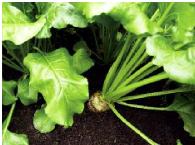
Kwotowanie produkcji cukru stanowi mechanizm nie tylko stabilizujący ten rynek, ale również gwarantujący plantatorom buraków bezpieczeństwo gospodarowania

Przedstawiciele Polski na różnych forach UE prezentują stanowisko dotyczące utrzymania systemu kwot w sektorze cukru po 30 września 2017 r., argumentując, że kwotowanie produkcji stanowi mechanizm stabilizujący ten rynek w UE i gwarantujący bezpieczeństwo gospodarowania plantatorów buraków cukrowych i producentów cukru, a także bezpieczeństwo żywnościowe dla UE w tym zakresie. W kontekście planowanego zniesienia kwoto-