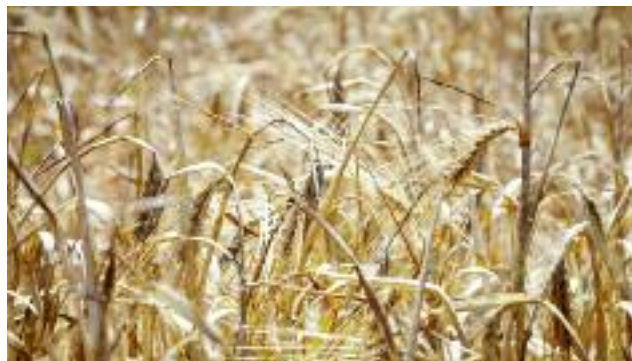
Podjęte zostały prace legislacyjne nad ujednoczeniem zasad szacowania szkód powstałych w wyniku niekorzystnych zjawisk atmosferycznych

Ponadto po pięciu latach prowadzenia monitoringu suszy od wydania ostatecznego rozporządzenia Ministra Rolnictwa i Rozwoju Wsi w sprawie wartości klimatycznego bilansu wodnego dla poszczególnych gatunków roślin uprawnych i gleb, w wyniku przeprowadzonych szczegółowych analiz oraz