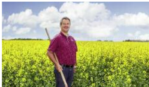
Znaczącą pomocą dla rolników byłoby przyspieszenie wypłat zaliczek w ramach płatności bezpośrednich z podniesieniem progu do 75% i terminu do końca sierpnia