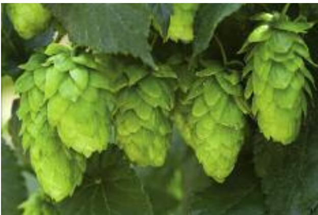
Polska stoi na stanowisku, że przepisy dot. certyfikacji chmielu powinny zostać uchylone

Polska stoi na stanowisku, że podczas przeglądu przepisów w zakresie wspólnej polityki rolnej, które odbędą się w 2016 i 2017 r., przepisy dotyczące