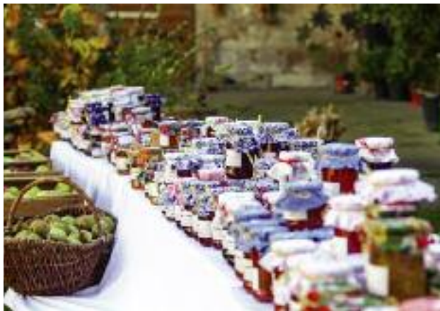
Stworzenie polskim rolnikom korzystnych warunków do rozwoju produkcji i sprzedaży detalicznej, żywności wyprodukowanej w całości lub w części z ich własnej uprawy, chowu lub hodowli – to podstawowy cel ustawy przygotowywanej przez MRiRW