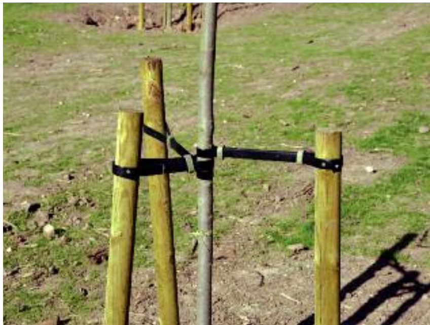
Dodatkowe pieniądze przysługują za zabezpieczenie uprawy leśnej przed zwierzyną stosując ogrodzenie albo zabezpieczenia trzema palikami

znaczone do zalesienia lub grunty z sukcesją naturalną nie ma opracowanego planu zagospodarowania przestrzennego oraz studium uwarunkowań i kierunków zagospodarowania przestrzennego gminy, rolnik może dołączyć do wniosku o sporządzenia planu zalesienia decyzji o warunkach zabudowy i zagospodarowania terenu określającej grunty przeznaczone do zalesienia;