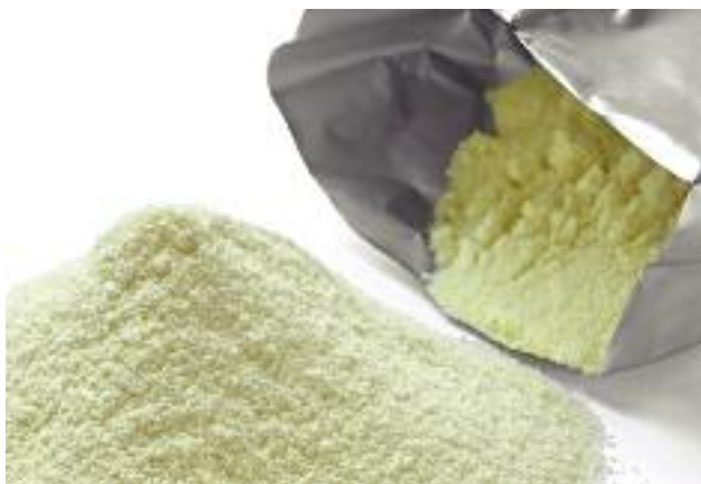
Od 20 kwietnia br. zakupy interwencyjne mleka w proszku są kontynuowane po stałej cenie interwencyjnej, a nie w drodze przetargu

W reakcji na zgłaszane przez Polskę postulaty, Komisja Europejska przedłożyła propozycje pakietu wsparcia mającego na celu ustabilizowanie sytuacji na rynkach. W ramach pakietu wprowadzono w 2016 r. podwojenie limitów skupu interwencyjnego dla masła do 100 tys. ton i odtłuszczonego mleka w proszku do 218 tys. ton. Dzięki temu