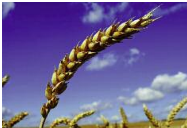
Na dopłaty do powierzchni obsianej lub obsadzonej materiałem siewnym kategorii elitarny lub kwalifikowany przewidziano w bieżącym roku kwotę 90 604 tys. zł

■ Wsparcie dla wytwarzania odpowiedniego materiału nasiennego do uprawy roślin i rolnictwa ekologicznego z wykorzystaniem standardów UE Przeprowadzone zostały konsultacje społeczne dot. barier i ograniczeń administracyjnych mających bezpośredni wpływ na dostępność materiału siewnego, nasion i wegetatywnego materiału rozmnożeniowego, wyprodukowanych metodami ekologicznymi w Polsce. Zebrany materiał jest analizowany w celu wypracowania rozwiązań identyfikowanych problemów.