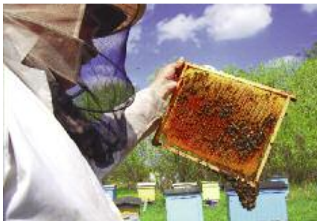
W ścisłej współpracy z pszczelarzami opracowany i przekazany do zatwierdzenia KE został Krajowy Program Wsparcia Pszczelarstwa

Należy zaznaczyć, że obecnie w Polsce nie ma dopuszczonego do obrotu leczniczego produktu weterynaryjnego zawierającego w swoim składzie substancję czynną – kumafos. W dniu 18 stycz-