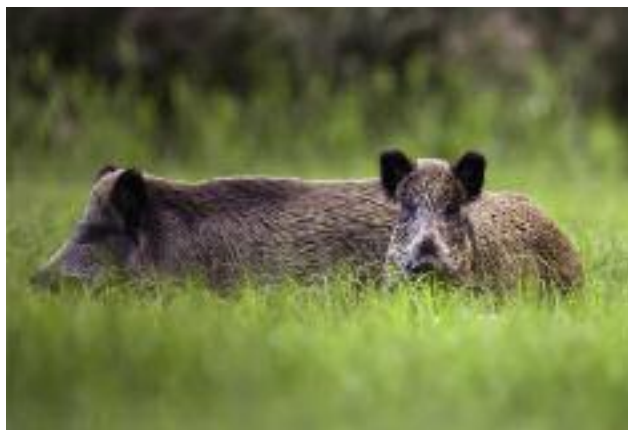
Minister Rolnictwa i Rozwoju Wsi, w drodze rozporządzenia, zarządził sanitarny odstrzał dzików

Zgodnie z art. 46 ust. 3 pkt 8 ustawy z dnia 11 marca 2004 r. o ochronie zdrowia zwierząt oraz zwalczaniu chorób zakaźnych zwierząt (Dz. U. z 2014 r. poz. 1539, z późn. zm.) Minister Rolnictwa i Rozwoju Wsi w drodze rozporządzenia zarządził przeprowadzenie odstrzału sanitarnego dzików.