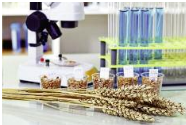
Na pięć programów wieloletnich realizowanych w obszarze produkcji roślinnej przeznaczono łączną kwotę 254 433 tys. zł

Krajowymi instrumentami wsparcia, które służą poprawie efektywności ekonomicznej i produktywności gospodarki rolno-żywnościowej są nowe programy wieloletnie Ministra Rolnictwa i Rozwoju Wsi zaplanowane do realizacji do roku 2020 oraz zadania na rzecz postępu biologicznego w produkcji roślinnej finansowane z budżetu MRiRW. W obszarze produkcji roślinnej realizowanych jest pięć programów wieloletnich, na które z budżetu państwa przeznaczono łączną kwotę 254 433 tys. zł.