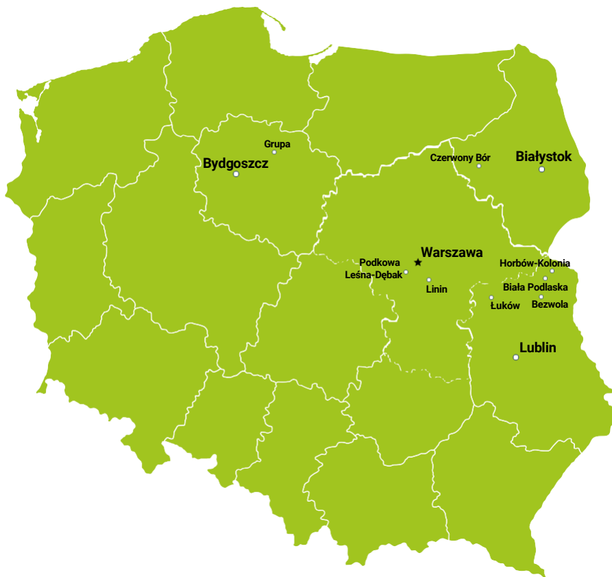
Карта Польши с расположением центров для иностранцев

Такой же принцип применяется и в отношении возможности перевода из одного центра проживания в другой. Решение в этом случае, после рассмотрения всех обстоятельств, принимает Департамент социальной помощи Управления по делам иностранцев. Ниже указаны места нахождения центров для иностранцев.