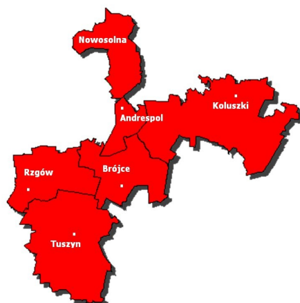
Mapa powiatu łódzkiego wschodniego

Czynione są starania o pozyskanie środków finansowych na budowę przyłącza kanalizacyjnego. Z pomocą przychodzą sponsorzy oraz Wojewódzki Fundusz Ochrony Środowiska Gospodarki Wodnej w Łodzi. Zostaje ogłoszony przetarg, który jest rozstrzygnięty w miesiącu październiku. W II połowie roku 2002 budowana jest sieć sanitarna w ul. Słowackiego, która kończy się na wysokości działki KP PSP. Po wielu trudnościach udaje się wybudować przyłącze.