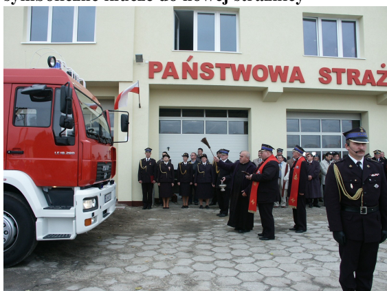
Kapelani obecni na uroczystościach wyświecają nowy samochód bojowy GCBA 5/48 MAN