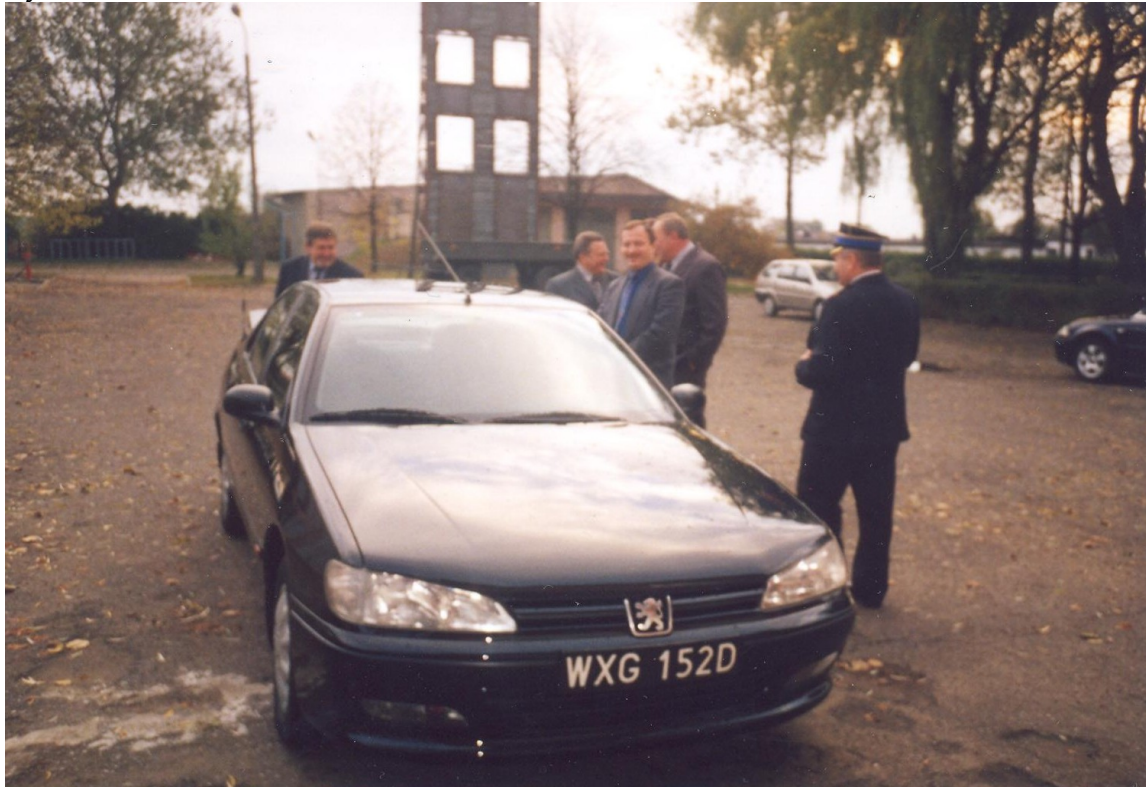
Uroczystość przekazania samochodu osobowego Peugeot 406 na dziedzińcu KP PSP