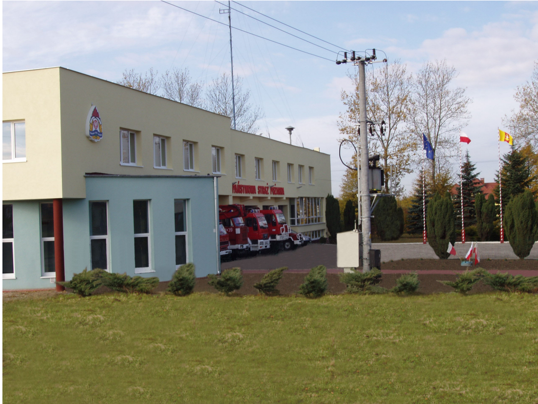
Front nowowbudowanej strażnicy