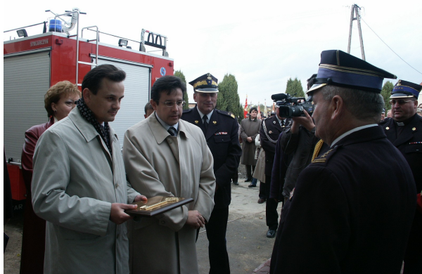
V-ce Wojewoda Łódzki Artur Ostrowski i były Wojewoda Łódzki Krzysztof Makowski przekazują symboliczne klucze do nowej strażnicy