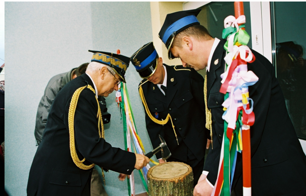
Komendant Główny PSP generał brygadier Teofil Jankowski dokonuje uroczystego przecięcia wstęgi