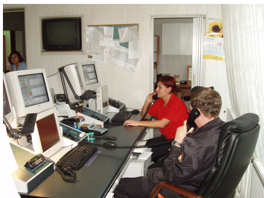
Stanowisko dyspozytorów CPR