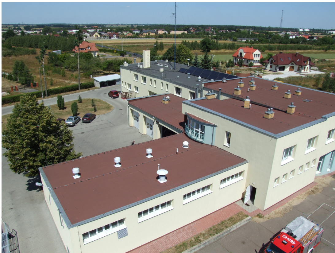
Tył rozbudowanej siedziby KP PSP