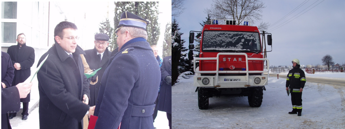
Wojewoda Łódzki Krzysztof Makowski przekazuje kluczyki do nowego samochodu bojowego GBA 8/16

W styczniu 2004 r. odbywa się narada podsumowująca rok 2003 podczas, której następuje uroczyste przekazanie samochodu ratowniczo - gaśniczego z napędem terenowym na podwoziu STARMAN. Nowy samochód ratowniczo - gaśniczy zastąpił samochód GCBA - 6/32, który został przekazany dla OSP w Justynowie.