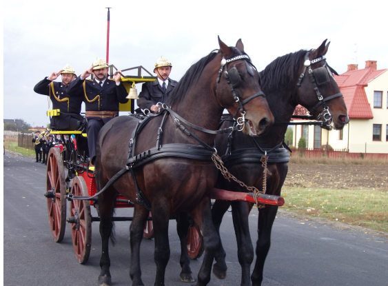
Przejazd bryczki z 1909 r. podczas uroczystej defilady