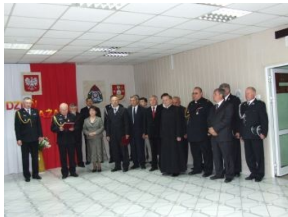
Uroczysty apel z udziałem zaproszonych gości z okazji Dnia Strażaka 2008 na świetlicy KP PSP