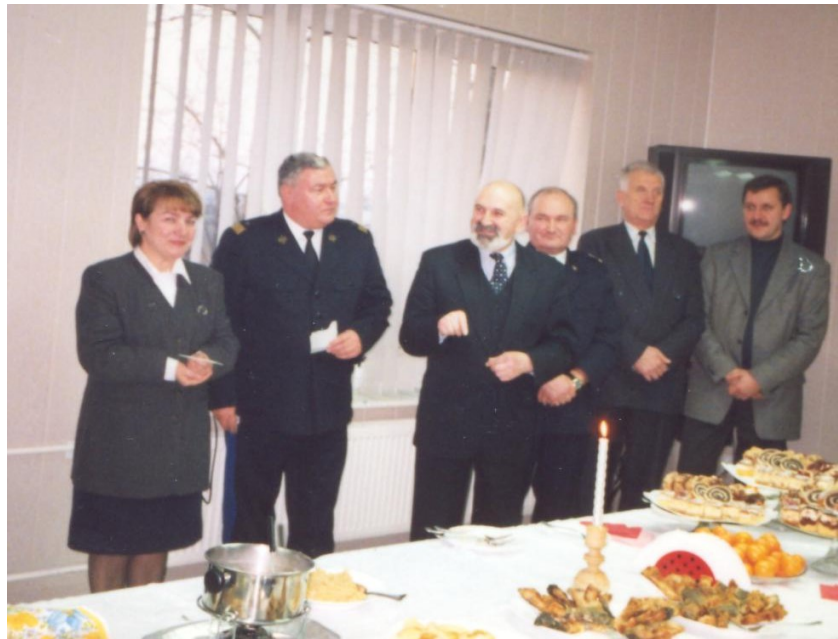
Spotkanie wigilijne w siedzibie Komendy w 2000 roku