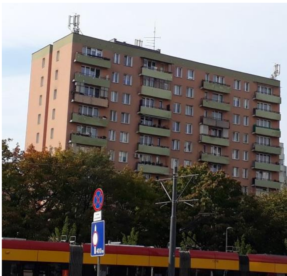
Fot. 1: Widok anten stacji bazowej ID: WAR2012_B, zlokalizowanej pod adresem: ul. Rembielińska 13, 03-352 Warszawa.