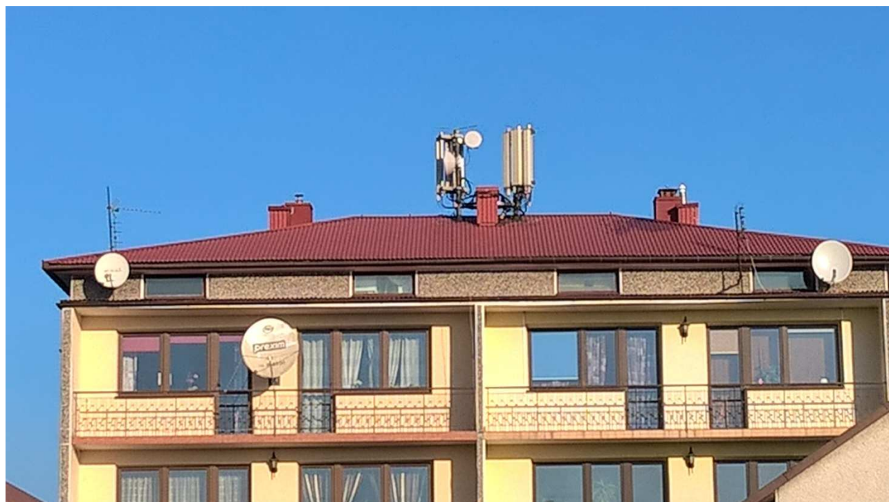
Fot. 2: Widok anten stacji bazowej ID stacji: KRA0233_B zlokalizowanej na dachu budynku mieszkalnego wielorodzinnego w Krakowie przy ul. Aleksandrowicza 4a-4b