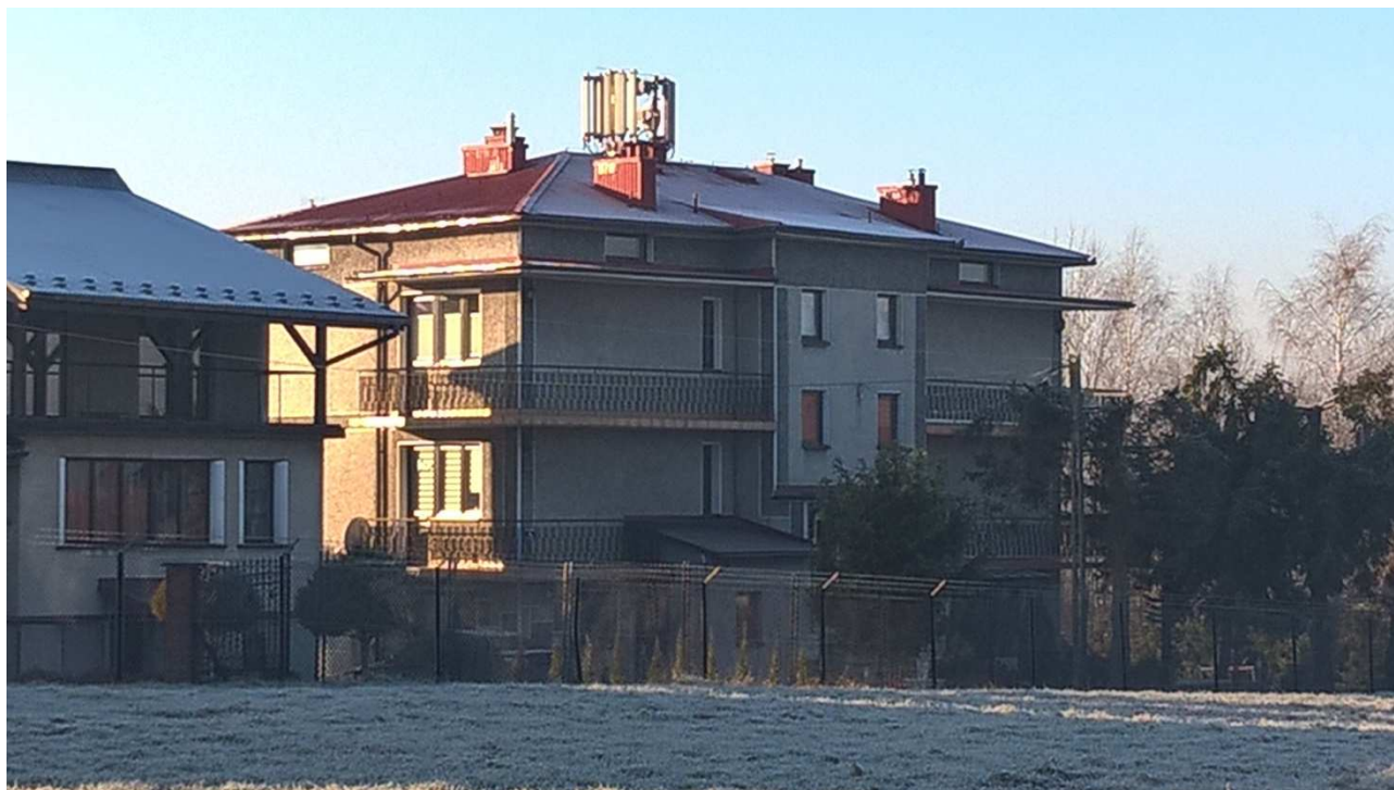
Fot. 1: Widok anten stacji bazowej ID stacji: KRA0233_B zlokalizowanej na dachu budynku mieszkalnego wielorodzinnego w Krakowie przy ul. Aleksandrowicza 4a-4b