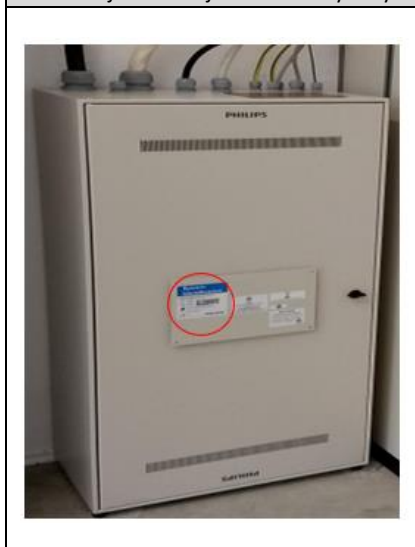
Ilustracja 3. Umieszczenie etykiety