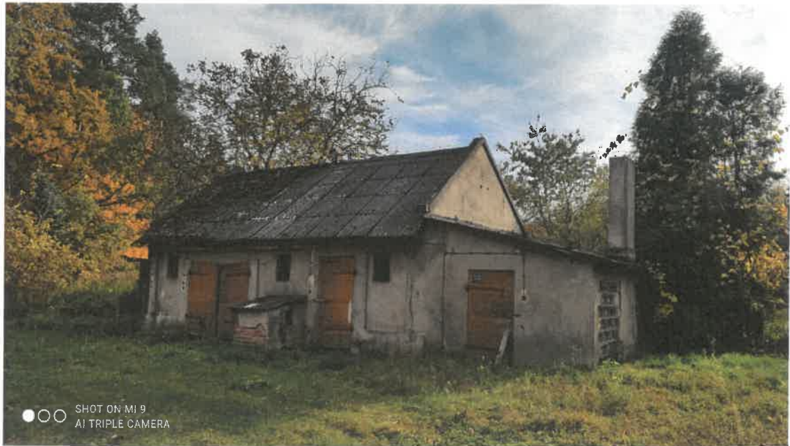
widok frontowy budynku gospodarczego z przybudówką