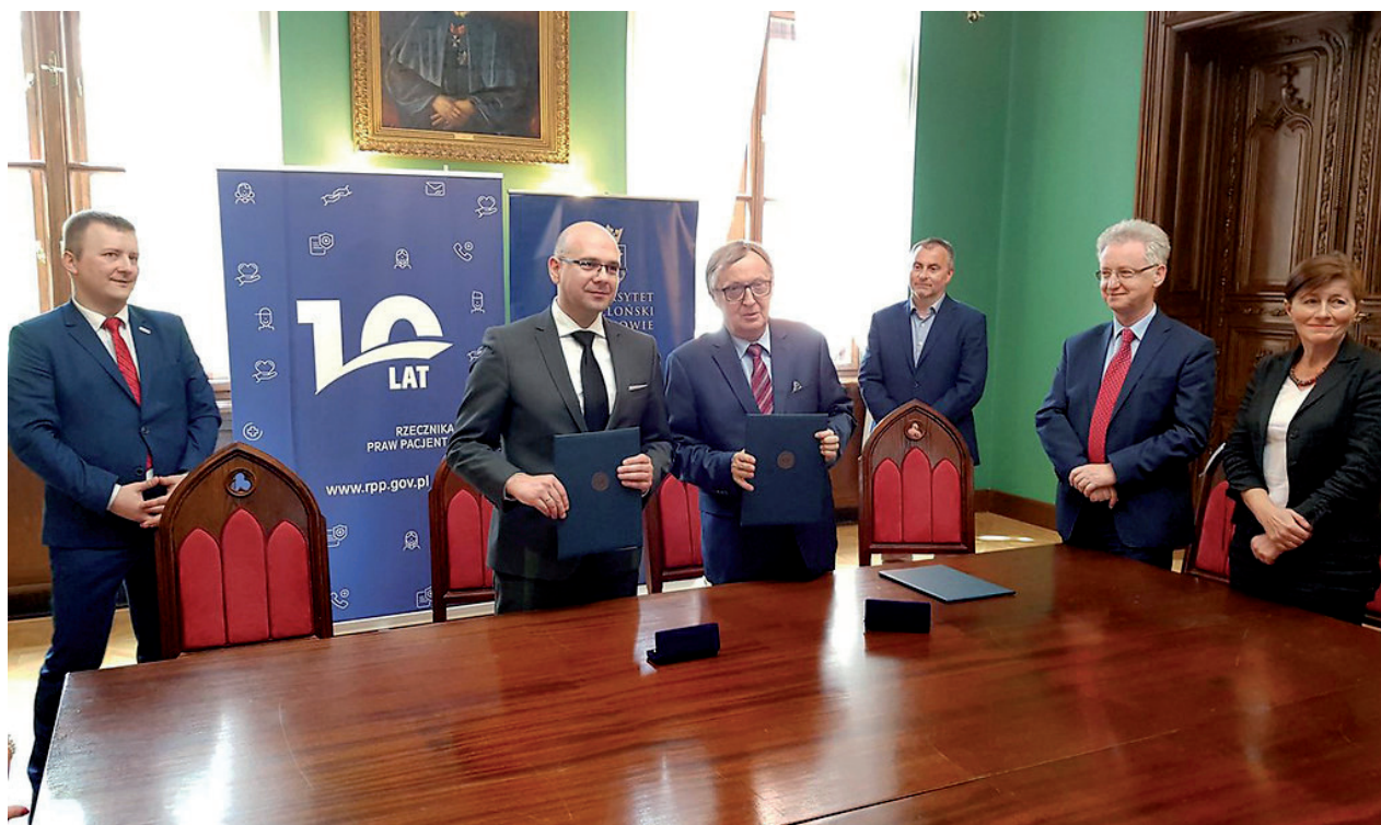
Sygnatariusze porozumienia Rzecznika Praw Pacjenta i Uniwersytetu Jagiellońskiego