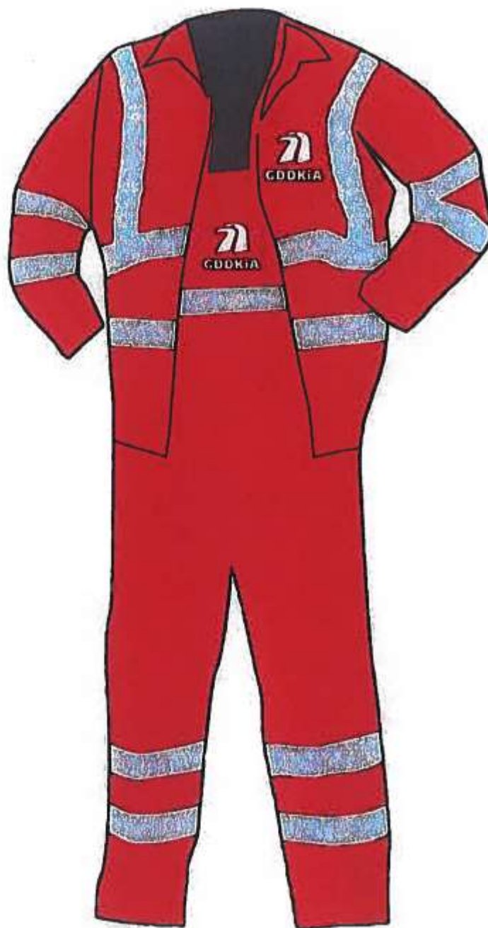
ubranie 2-częściowe letnie, zimowe - przód