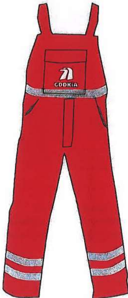
spodnie letnie i zimowe