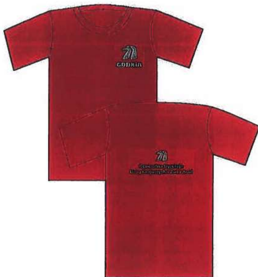
koszulka z krótkim rękawem - przód i tył