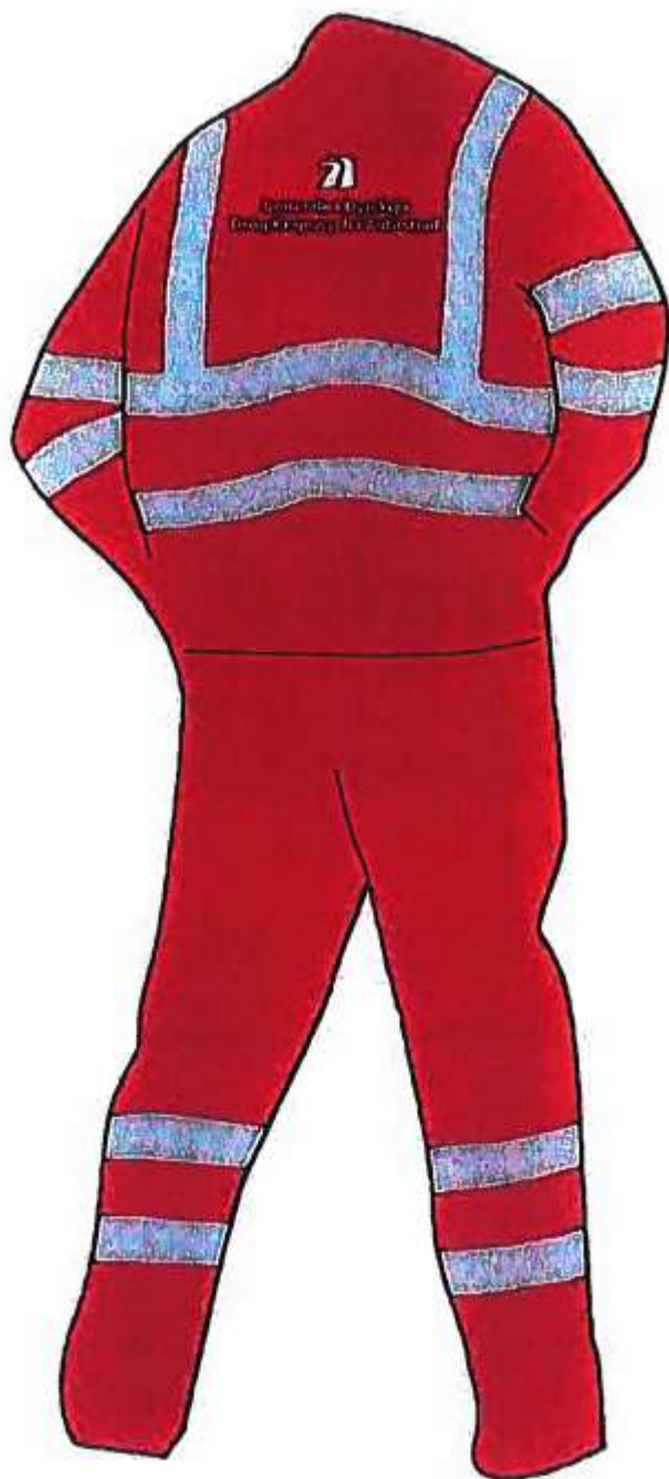
ubranie 2-częściowe letnie, zimowe - tył