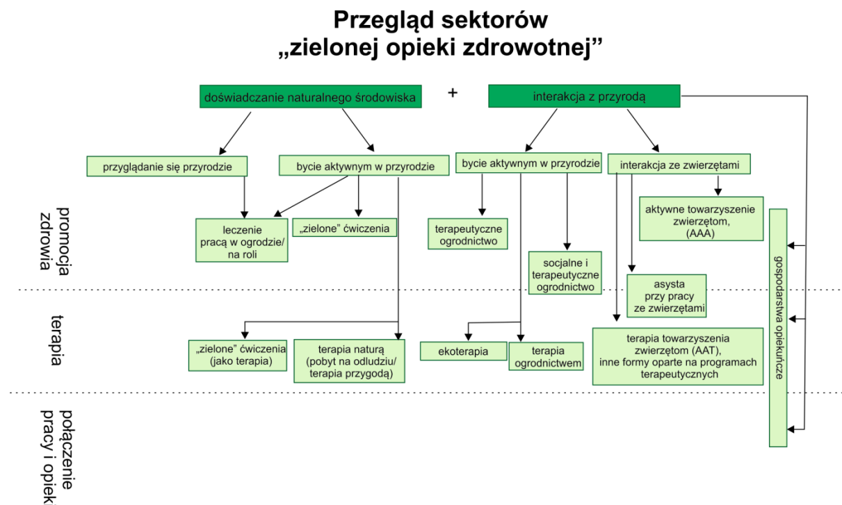
Rysunek 2. Przegląd rodzajów „zielonej opieki zdrowotnej”