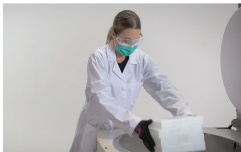
Maseczki stosuje się z powodu pandemii.

Po wyjęciu tacek z fiolkami z transportowego pojemnika termicznego szczepionki należy natychmiast włożyć do zamrażarki o bardzo niskiej temperaturze (ULT) (-90°C do -60°C).