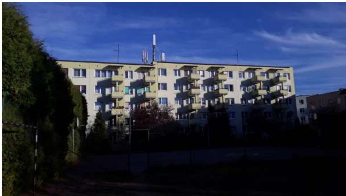
Fot. 1: Widoki anten stacji bazowej ID: OLS1022, zlokalizowanej: ul. Gałczyńskiego 11, 10-089 Olsztyn