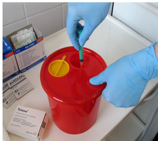
Tabela. Stwierdzone choroby zakaźne i pasożytnicze w 2016 i 2017 r.