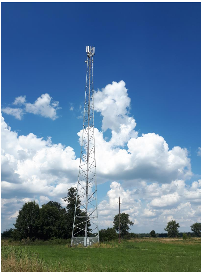
Fot. 1: Widok anten stacji bazowej ID: ZGO3062, zlokalizowanej pod adresem: działka nr 979, obręb 0057 Zawada, 66-001 Zielona Góra