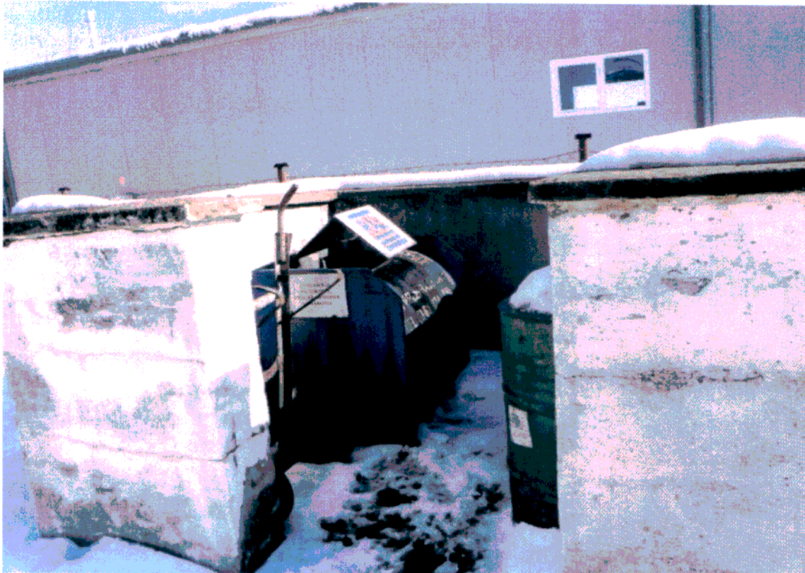
Ryc. 2. Miejsce magazynowania olejów odpadowych w Poczta Polska S.A. Centrum Logistyki Dział Techniczny w Przemyśle – brak zabezpieczenia miejsca magazynowania odpadów przed opadami atmosferycznymi [P1010177]

Podczas kontroli 2 podmiotów, stwierdzono wytwarzanie odpadów mimo braku dokumentów regulujących stan formalno – prawny w tym zakresie. W pozostałych przypadkach, zakłady posiadały uregulowany stan formalno-prawny w zakresie wytwarzania oraz gospodarowania odpadami.