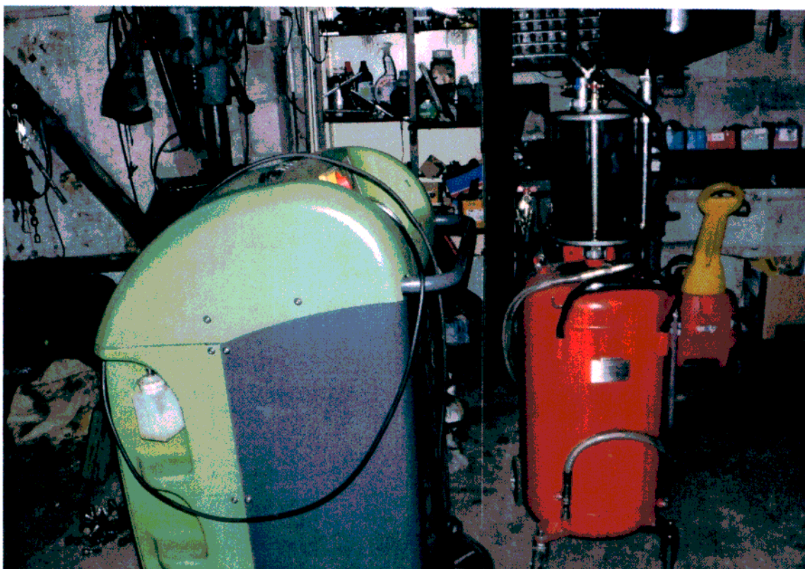
Ryc. 3 Wyposażenie warsztatu samochodowego w miejscowości Markowa – urządzenie do serwisu klimatyzacji samochodowej oraz wysysarka do olejów przepalonych.

Podczas przeprowadzonych w ramach cyklu kontroli, nie stwierdzono przypadków spalania olejów odpadowych ani też innych działań sprzecznych z prawem dotyczących zagospodarowania olejów przepalonych.