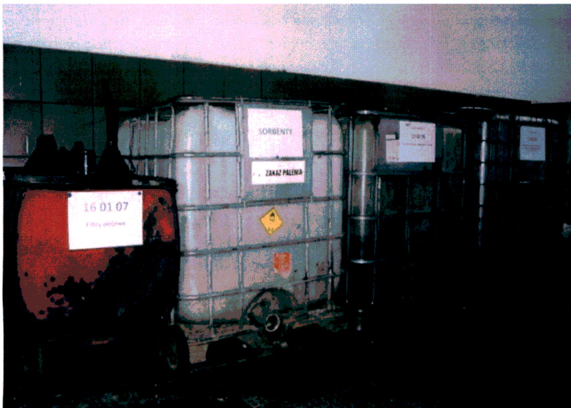
Ryc. 1 Pojemniki do magazynowania olejów przepracowanych – stacja demontażu pojazdów w Szczepańcowej [P1070560].

Z 80 zakładów prowadzących działalność powodującą powstawanie zużytych olejów skontrolowano 36 stacji demontażu pojazdów, 24 podmioty eksploatujące maszyny i urządzenia, 12 stacji obsługi środków transportu oraz 8 przedsiębiorców eksploatujących tabor samochodowy.