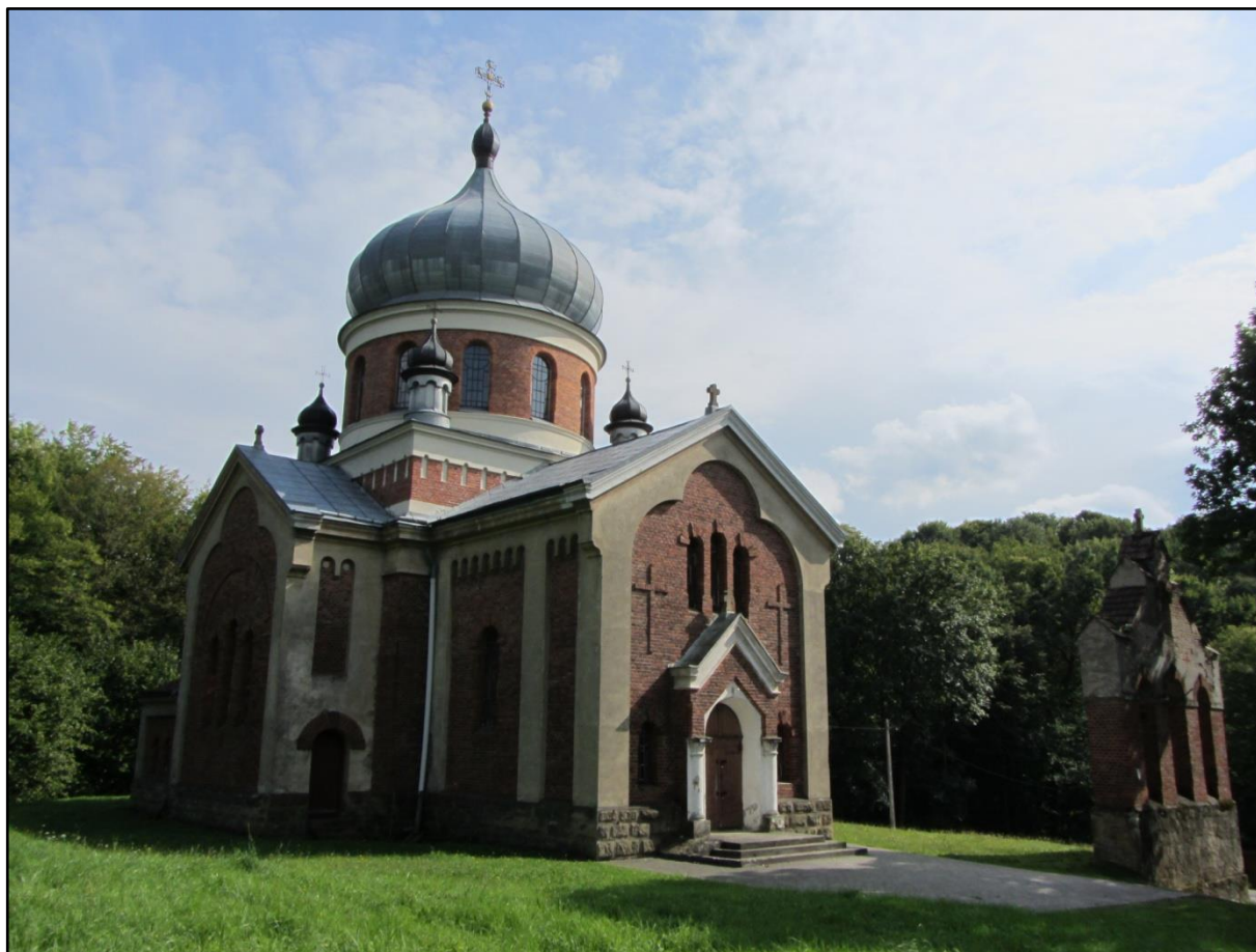
Cerkiew w Rzepniku

Stan gatunku w regionie kontynentalnym, wg Raportu z Art 17DS, 2013 r.: FV.