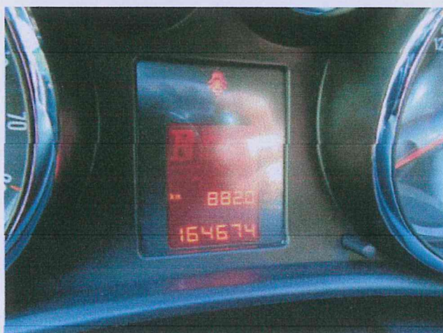
Fot. 6 Stan licznika przejechanych kilometrów.