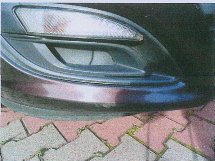
Fot. 11 Zarysowany spoiler zderzaka