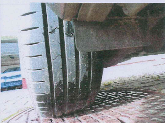
Fot. 12 Stan ogumienia - zużycie 50% (3,8 mm)