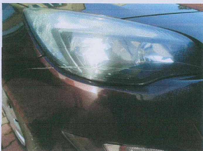
Fot. 10 Zarysowany reflektor - lewy