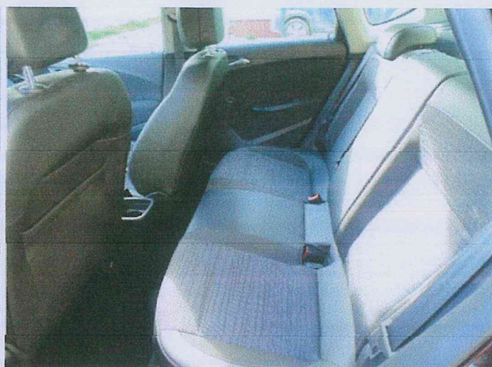
Fot. 8 Widok wnętrza w tylnej części