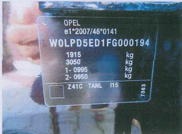
Fot. 1 1 Tabliczka znamionowa