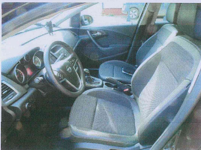
Fot. 9 Widok wnętrza pojazdu od strony kierowcy