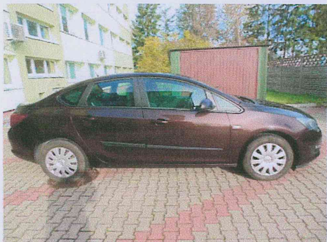
Fot. 3 Widok badanego pojazdu.