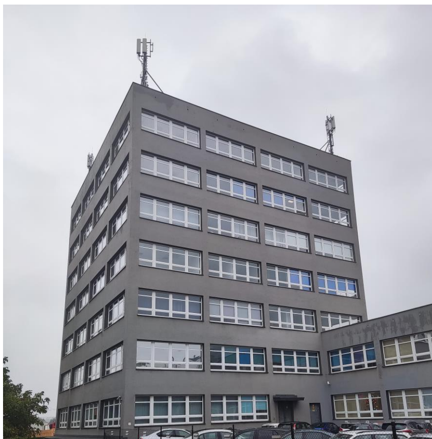
Fot. 1: Widoki anten stacji bazowej: ID: 1674, zlokalizowanej: ul. Grabowa 2, Katowice