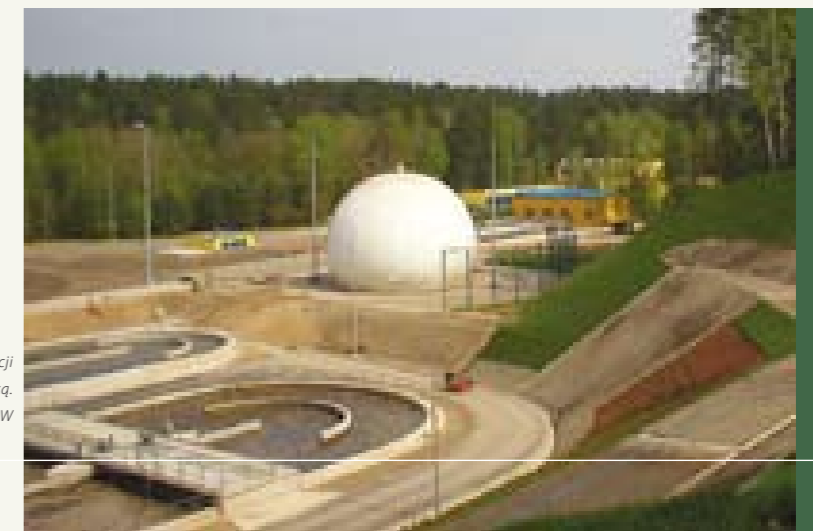
Oczyszczalnia ścieków w Olsztynie po modernizacji dofinansowanej przez NFOŚiGW i Unię Europejską.

durę ubiegania się o dofinansowanie. Opracowane programy priorytetowe oraz informacje o terminach przyjmowania wniosków o dofinansowanie są publikowane na stronie internetowej Narodowego Funduszu.