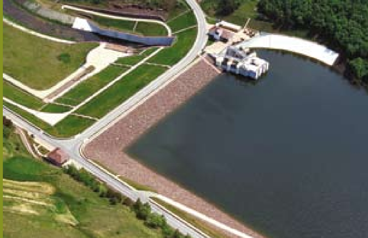
Dofinansowany przez NFOŚiGW zbiornik Włódy z lotu ptaka.