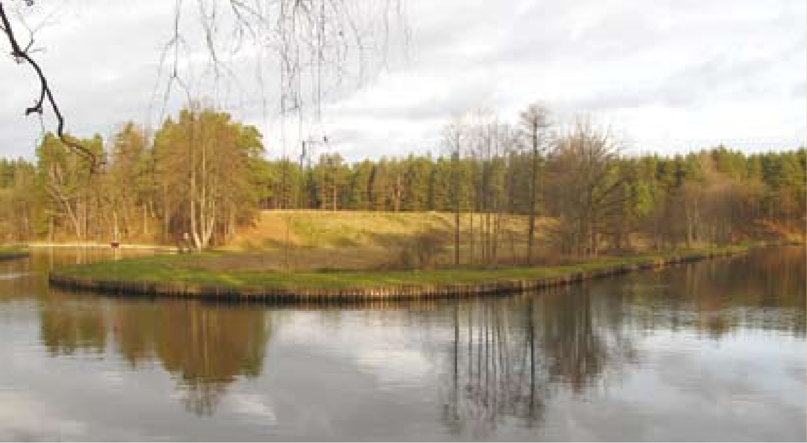
Kanal Augustowski po renowacji dofinansowanej ze środków NFOŚiGW.

Narodowy Fundusz Ochrony Środowiska i Gospodarki Wodnej , który w 2009 roku obchodzi 20-lecie istnienia, jest wspólnie z wojewódzkimi funduszami filarem polskiego systemu finansowania ochrony środowiska. Podstawą działania Narodowego Funduszu jest ustawa Prawo ochrony środowiska. Narodowy Fundusz, jako państwowy fundusz celowy, ma osobowość prawną i prowadzi