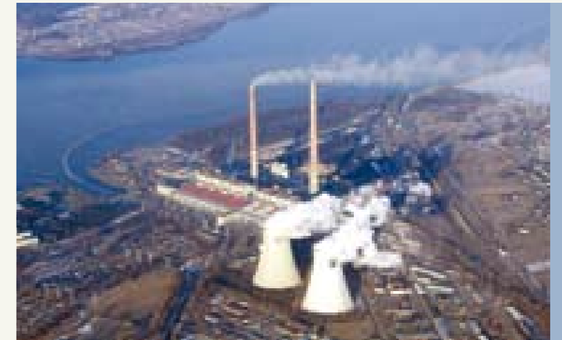
Krajowy Operator Systemu Zielonych Inwestycji w ramach międzynarodowego handlu uprawnieniami do emisji gazów cieplarnianych – to nowe zadanie Narodowego Funduszu.

sięwzięcia ochrony środowiska i gospodarki wodnej zostały zasilone w 2008 roku rekordową kwotą ponad 4,6 mld zł . W 2009 roku przewidujemy zwiększenie tej kwoty do 7 mld zł .