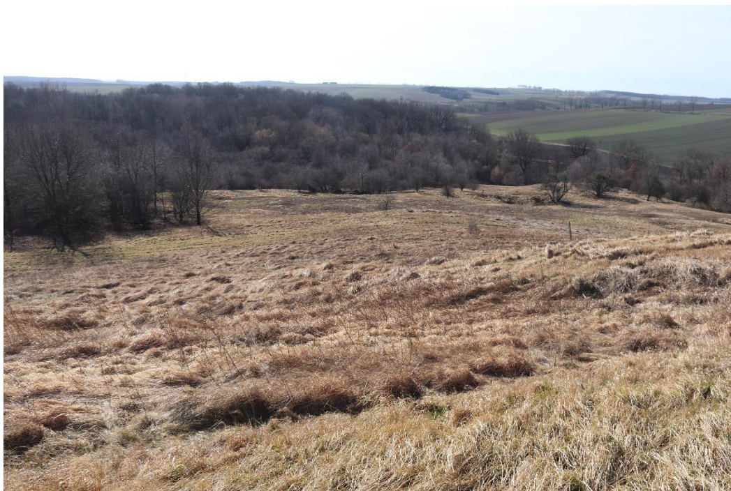
Fot.3. Widok z północnej części rezerwatu na środkową i południową część murawy.