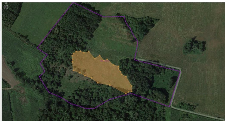
Rys.4. Powierzchnię objętą działaniami związanym z usuwaniem szczyli oznaczono żółtym poligonem.

2.4. Ograniczenie ekspansji szczyli pospolitej Dipsacus fullonum poprzez wrywanie i wykopywanie w trzech terminach: I termin od 14.06.2022 r.- 30.06.2022r., II termin: 19.07.2022 r.- 16.08.2022 r. oraz III od 10.09.2022- 20.09.2022r. Prace na powierzchni murawy odtwarzanej prowadzić pod nadzorem przyrodniczym, który zapewnia Zamawiający. Powierzchnia pokrycia szczylią w tym miejscu to nie więcej niż 35% na powierzchni 1,6 ha murawy odtwarzanej. Biomase należy zebrać i zutylizować poza obszarem ww. rezerwatu przyrody.