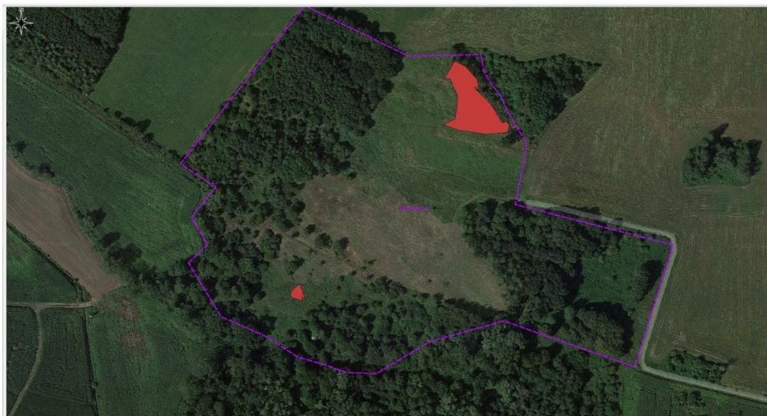
Rys.3. Mapa poglądowa lokalizacji płatów trziny i trzcinnika na terenie muraw.

2.4. Ograniczenie ekspansji szczyli pospolitej Dipsacus fullonum poprzez wrywanie i wykopywanie w trzech terminach: I termin od 14.06.2022 r.- 30.06.2022r., II termin: 19.07.2022 r.- 16.08.2022 r. oraz III od 10.09.2022- 20.09.2022r. Prace na powierzchni murawy odtwarzanej prowadzić pod nadzorem przyrodniczym, który zapewnia Zamawiający. Powierzchnia pokrycia szczylią w tym miejscu to nie więcej niż 35% na powierzchni 1,6 ha murawy odtwarzanej. Biomase należy zebrać i zutylizować poza obszarem ww. rezerwatu przyrody.