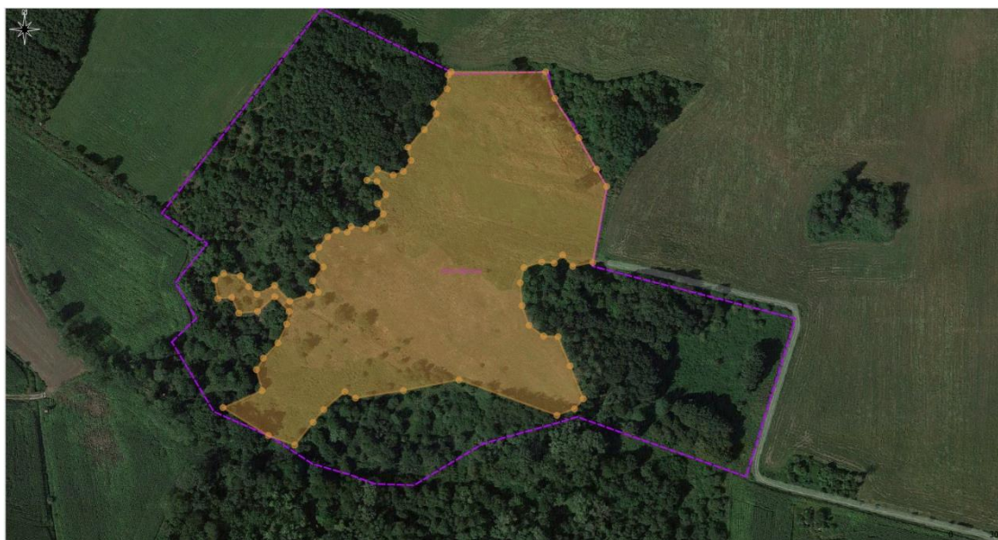
Rys.1 Obszar powierzchni całej murawy kserotermicznej oznaczono poligonem w kolorze żółtym (2/3 obszaru przeznaczone do wykoszenia po wskazaniu przez nadzór przyrodniczy)

* Poprzez mechanicznie koszenie rozumie się użycie kos spalinowych lub małogabarytowych kosiarek o wadze do 500 kg. Zamawiający nie dopuszcza użycia sprzętu rolniczego (ciągnik + kosiarka bijakowa, talerzowa itp.) Koszenie kosami spalinowymi tylko przy użyciu metalowych narzędzi tnących (nóż, trójzęb/trapez, tarcza).