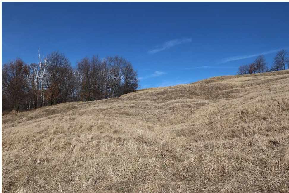
Fot.1. Widok na murawę w części północnej. Widoczne nachylenie terenu.

Powierzchnia obszaru objętego pracami silnie opada w kierunku południowym, jest to teren pokopalniany. Występują tu ponadto znaczne nierówności. Obszar ten obecnie prawie w całości pozbawiony jest roślinności wysokiej i zajmowany jest przez murawy kserotermiczne.