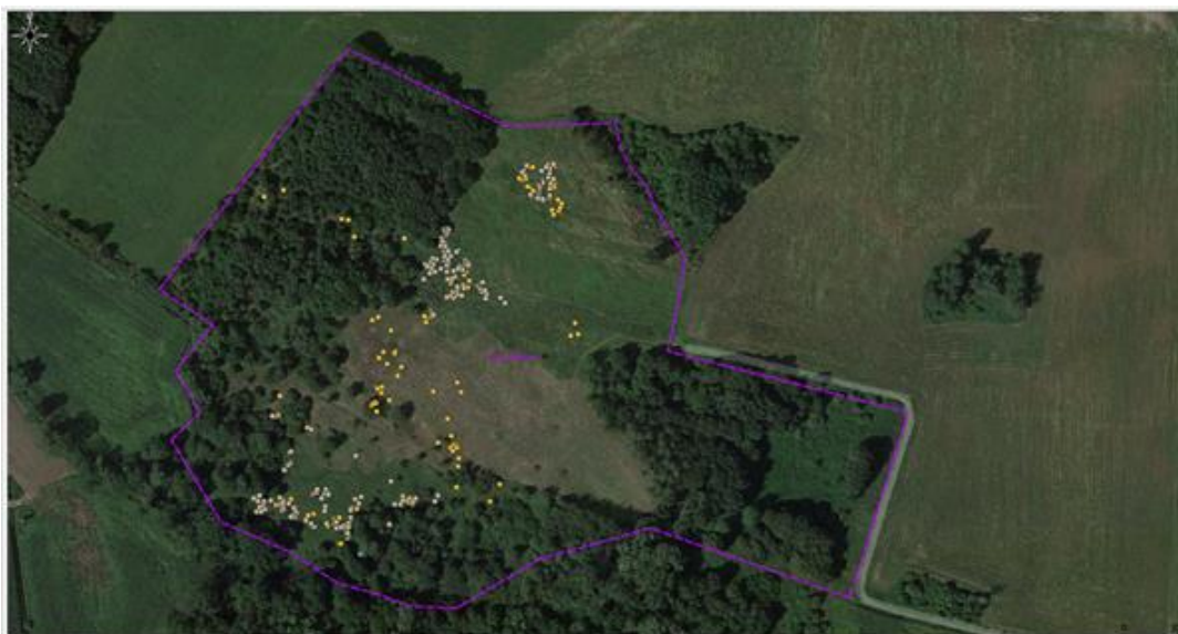
Rys.5. Obszar działań ochronnych obejmuje cały obszar rezerwatu, na rysunku zaznaczono poglądowo lokalizację ww. gatunku inwazyjnego.

Biomasę należy zebrać i zutylizować poza obszarem rezerwatu przyrody.