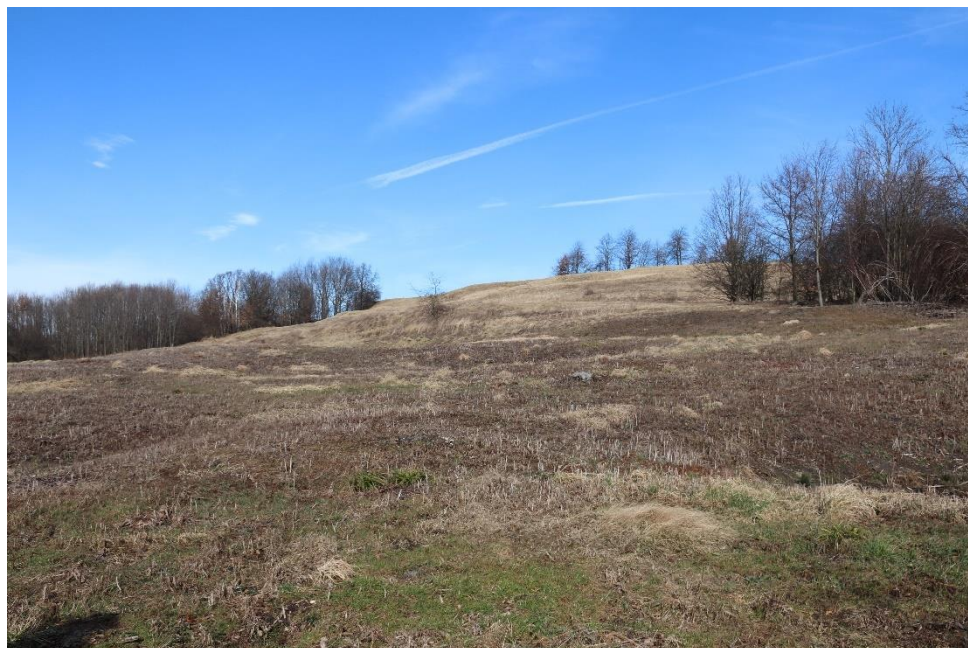
Fot.2. Odtwarzana murawa w części środkowej ww. rezerwatu przyrody.

W granicach rezerwatu przyrody zlokalizowane są płyty inwazyjnego barszczu Sosnowskiego; bezpośredni kontakt z tą rośliną grozi wystąpieniem obrażeń ciała, w związku z czym wszelkie prace w rezerwacie należy wykonywać z zachowaniem szczególnej ostrożności. Egzemplarze barszczu Sosnowskiego będą usuwane w ramach odrębnego zlecenia.