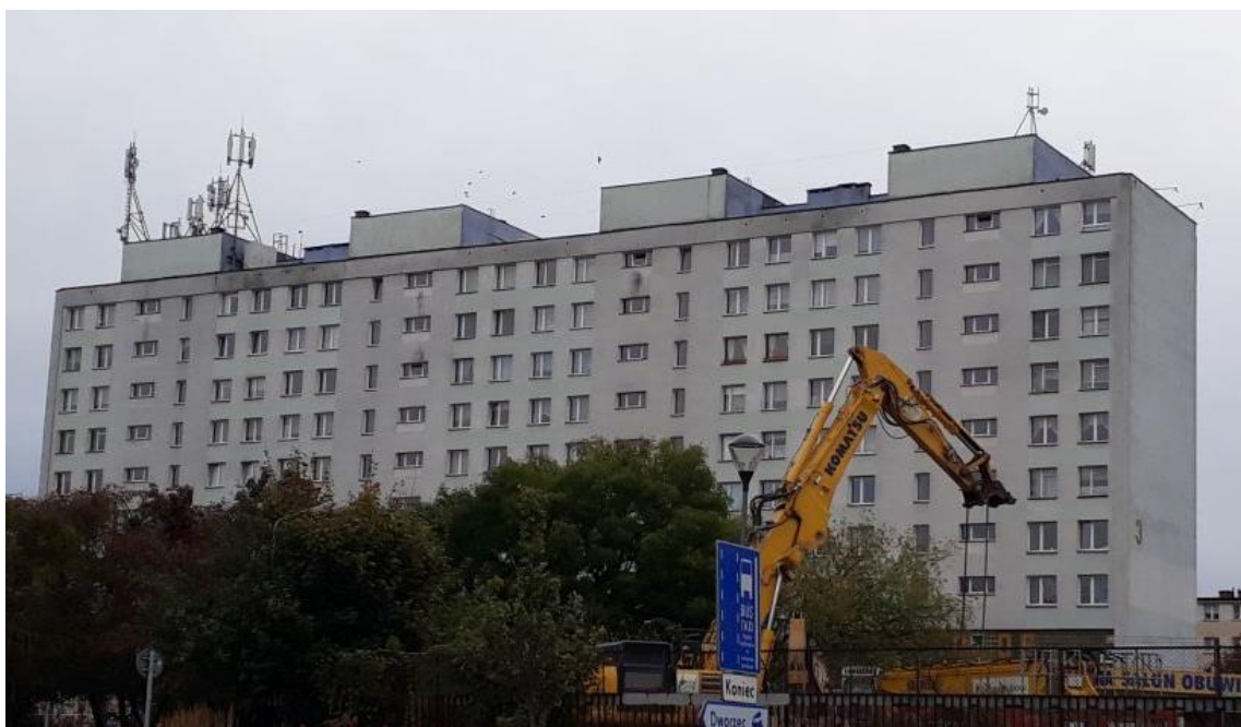
Fot. 1: Widok anten stacji bazowych: ID: BT42363, ID: OLS1043_B, zlokalizowanych pod adresem: ul. Plac Konstytucji 3 Maja 3, 10-589 Olsztyn