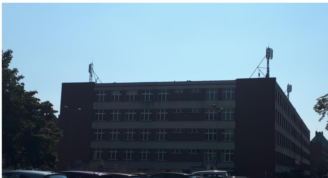
Fot. 1: Widok anten stacji bazowej ID: 2338, zlokalizowanej pod adresem: ul. Bankowa 11, 40-007 Katowice