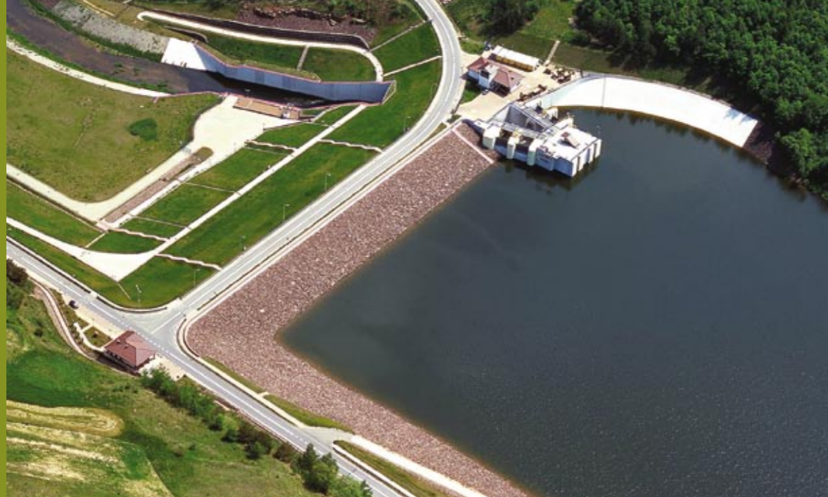
Дофинансированное НФООСиВХ водохранилище Вары (Włódy) с высоты птичьего полета.