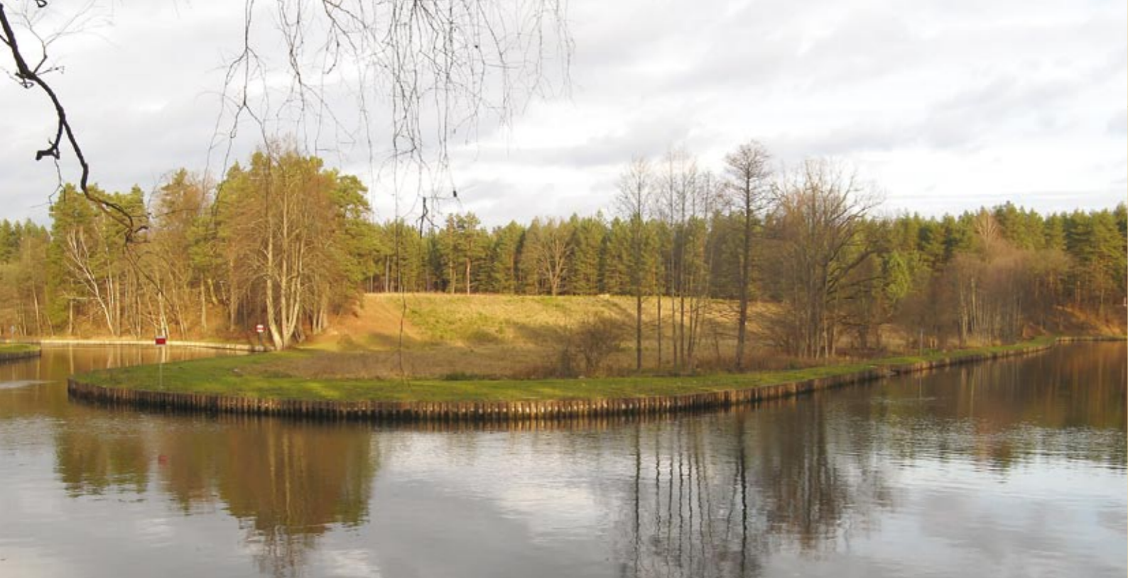
Августовский канал после обновления, дофинансированного из средств НФООСЦВХ.

Национальный Фонд охраны окружающей среды и водного хозяйства , который в 2009 году празднует 20-летие существования, является наряду с воеводскими фондами основой польской системы финансирования охраны окружающей среды. Основой действия Национального Фонда является Закон об охране окружающей среды. Национальный Фонд, как целевой государственный фонд, имеет правоспособность