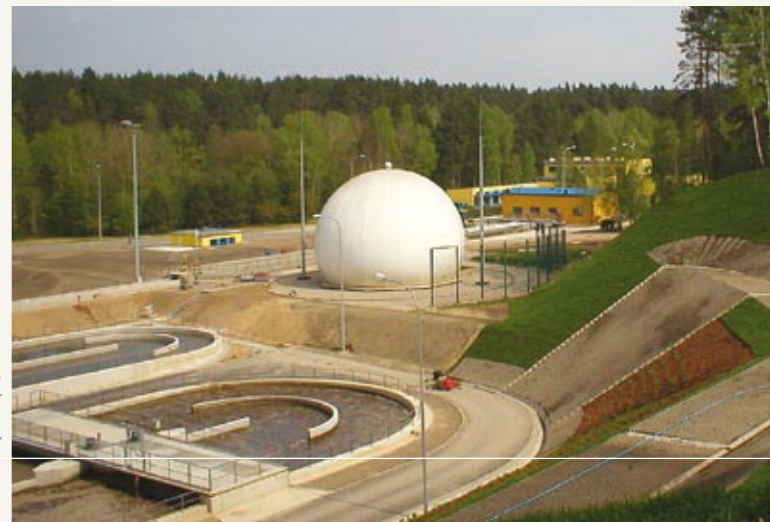
Очистное сооружение в г. Ольштын после модернизации, дофинансированной НФООСЦВХ и Европейским Союзом.

нансирование. Разработанные приоритетные программы, а также информация о сроках приема заявок на дофинансирование публикуются на сайте Национального Фонда.