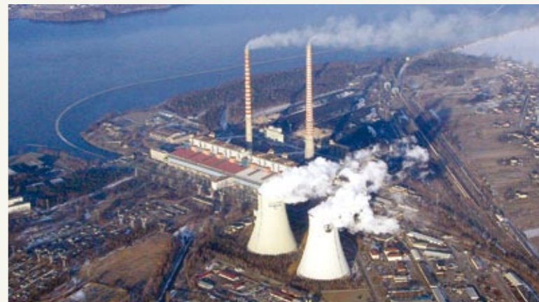
Национальный Оператор Системы зеленых инвестиций в рамках международной торговли квотами на эмиссии парниковых газов – это новая задача Национального Фонда.

му свыше 1,9 млрд. зл. Вместе с трансфером заграничных средств, обслуживаемых Национальным Фондом, мероприятия по охране окружающей среды и водного хозяйства были поддержаны в 2008 году рекордной суммой свыше 4,6 млрд. злотых. В 2009 году предусматриваем увеличение этой суммы до 7 млрд. зл.