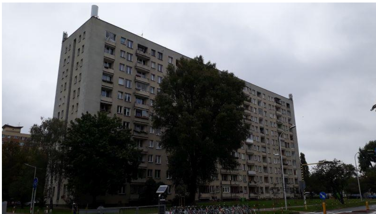
Fot. 1: Widok anten stacji bazowej ID: WAR2146_A, zlokalizowanej pod adresem: ul. Chodecka 1, Warszawa