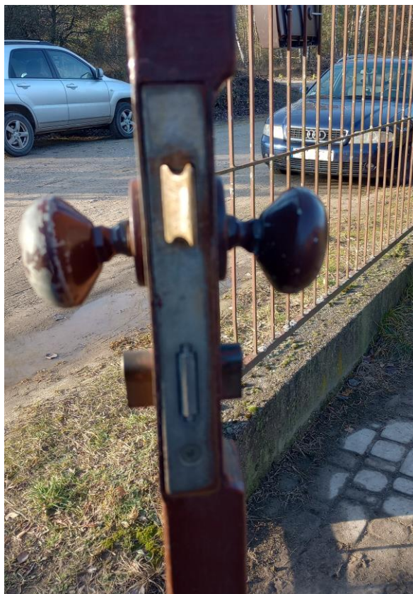
Fot. 7 Budynek mieszkalny – furka 2