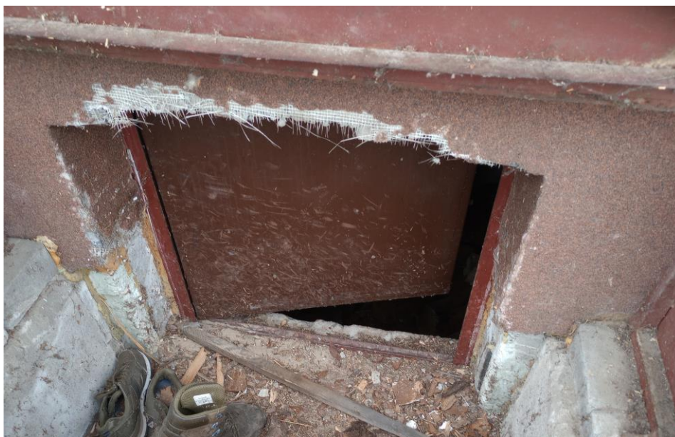
Fot. 1 Budynek mieszkalny – okno zsypane 1