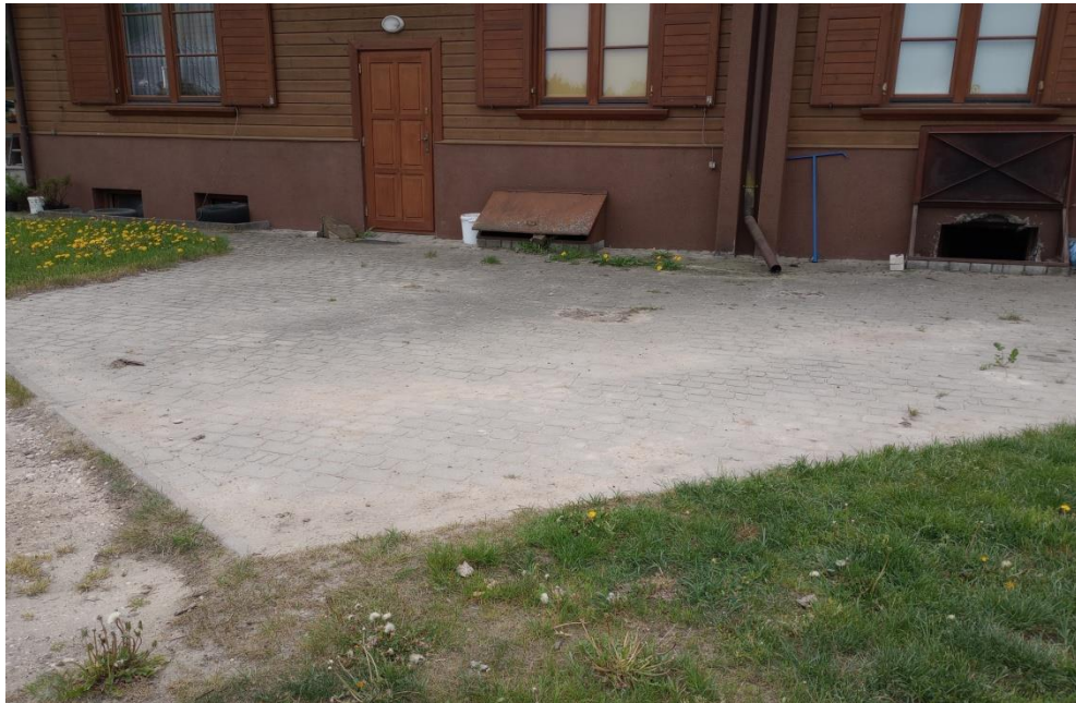
Fot. 3 Budynek mieszkalny – utwardzenie terenu