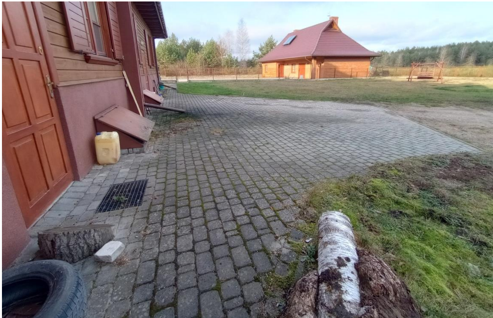
Fot. 4 Budynek mieszkalny – utwardzenie terenu