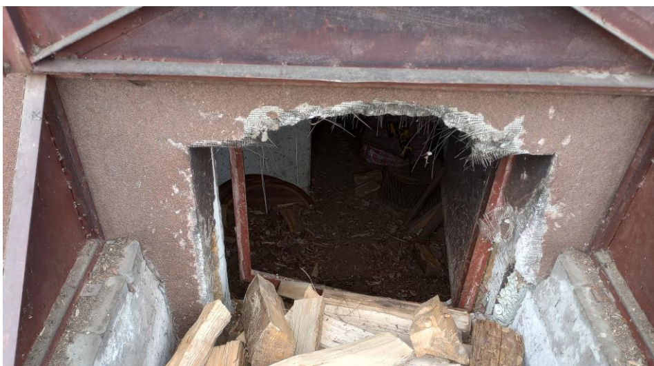
Fot. 2 Budynek mieszkalny – okno zsypane 2