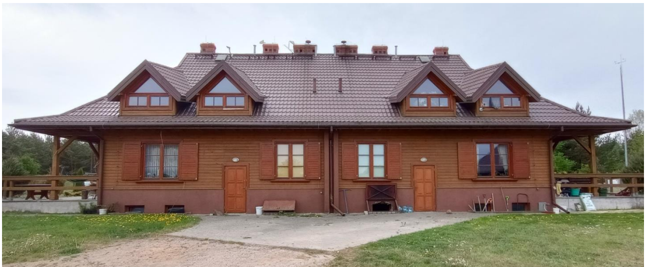
Fot. 5 Budynek mieszkalny – elewacja tylna