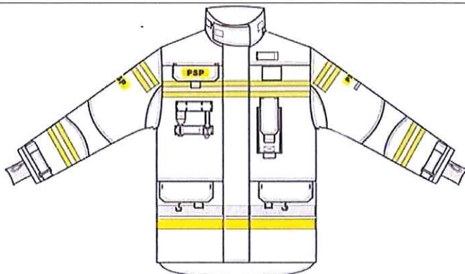
Przykładowy widok kurtki