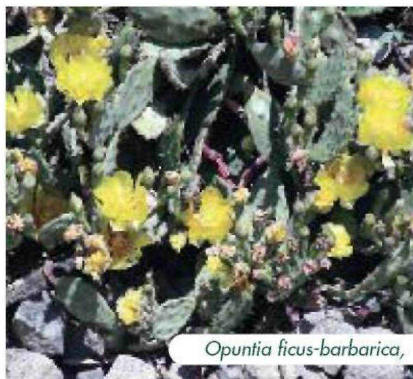
Opuntia ficus-barbarica ,

Zestaw kodeksów St Louis opracowano na podstawie spotkania przedstawicieli branży szkółek ogrodniczych, ogrodów botanicznych, architektów krajobrazu, organów ds. ogrodnictwa w St Louis w amerykańskim stanie Missouri w roku 2001. Kodeksy powstały jako dobrowolne wytyczne lub najlepsze praktyki zarządzania w celu zapobiegania wprowadzaniu i rozprzestrzenianiu się roślin inwazyjnych. W Załączniku nr 4 znajduje się kopia kodeksu dla ogrodów botanicznych.