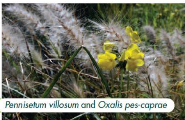
Pennisetum villosum and Oxalis pes-caprae

Powszechnie przyjmuje się, że w przeciągu najbliższych 50-100 lat globalna zmiana klimatu przyniesie szereg skutków w obszarze środowiska naturalnego i dystrybucji gatunków. Jej konsekwencje, jak np. rosnące poziomy dwutlenku węgla i temperatura, wraz ze zmianą wykorzystania gruntów, wzrostem populacji i ruchami ludności, mogą szczególnie oddziaływać zarówno pozytywnie, jak i negatywnie na wzrost roślin i ryzyka inwazji (Bradley i in., 2010). Choć związek zmiany klimatu z bioróżnorodnością jest wciąż w stadium początkowym, a dokładne prognozy w odpowiedniej skali, szczególnie w zakresie konkretnych reakcji gatunków dziko rosnących, okazały się trudne (Parmesan i in., 2011), mamy już dość dowodów na oddziaływanie ostatnich zmian w obszarze występowania gatunków i ekosystemów, które można przypisać skutkom zmiany klimatu. Gatunki powszechnie reagują na zmianę klimatu poprzez zmiany cech fenologicznych, jak np. zmiany czasu wypuszczania pąków, kwitnienia, owocowania, ubarwienia liści i ich opadania (Cleland i in., 2007). W celu zapoznania się z wpływem zmiany klimatu na bioróżnorodność, warto zajrzeć do publikacji Rady Europy (2010), na europejskie i śródziemnomorskie gatunki roślin – z pracą Heywooda (2009, 2011b, 2012), a z globalną analizą roślin i zmiany klimatu przeprowadzoną przez BGCI – z pracą Hawkinsa i in. (2008).