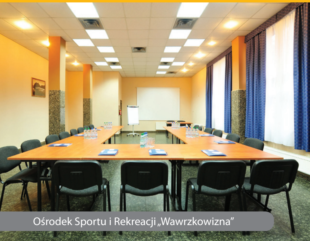
Ośrodek Sportu i Rekreacji „Wawrzkowizna”

Ośrodek dysponuje trzema zróżnicowanymi pod względem wielkości salami konferencyjnymi (15 m 2 , 57 m 2 , 85 m 2 ) pozwalającymi na organizację spotkań dla grup do 70 osób.