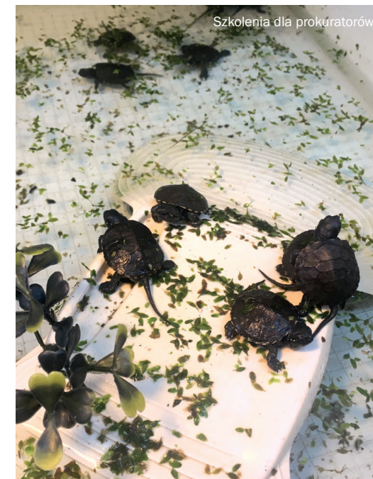
Szkolenia dla prokuratorów

Other target groups, for whom this time two day long trainings were organised, were representatives of the prosecution authorities (the Police, the Prosecution Service) and judicial authorities. All over Poland, there were 17 trainings for the Police (2018–2019), 11 (in 2019) for prosecutors, and 9 (2020–2021) for judges. In total, 518 Police officers, 265 prosecutors and some 200 judges have been trained. As in case of the trainings for NGOs, the objective of the trainings for the prosecution and judicial authorities was to communicate basic knowledge on nature conservation and enforcement of law in this