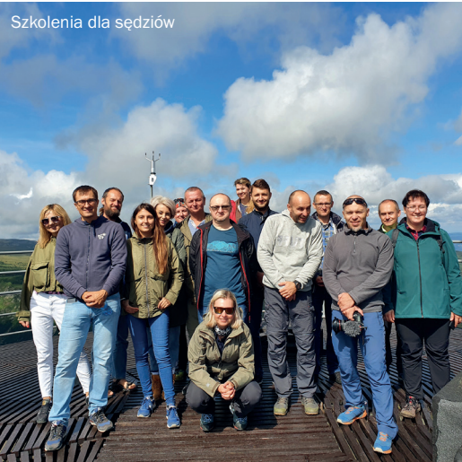
Szkolenia dla sędziów