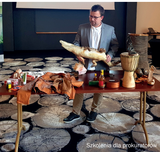
Szkolenia dla prokuratorów

Due to SARS-CoV-2 pandemic restrictions, there have been difficulties in organising a cycle of training sessions for judges. There was a risk that the trainings would not take place. Therefore, an e-learning course was developed for judges, covering the merits of the training. The course was published in August 2021 via an educational platform of the National School of the Judiciary and the Prosecution Service [Krajowa Szkoła Sądownictwa i Prokuratury], which will make it possible to reach the target group to a maximum extent. The e-learning course will remain available also upon Project completion.