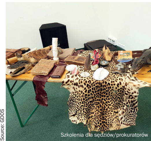
Szkolenia dla sędziów/prokuratorów