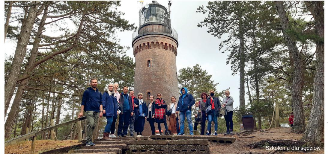
Szkolenia dla sędziów