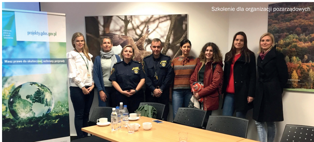
Szkolenie dla organizacji pozarządowych