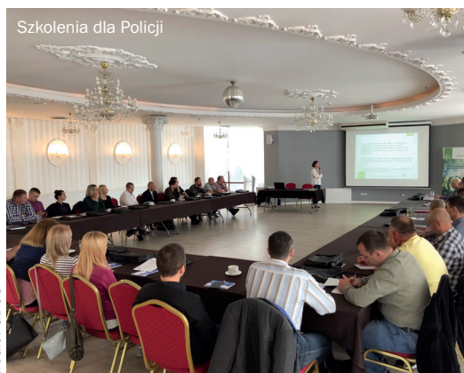
Szkolenia dla Policji

Kolejnymi grupami docelowymi dla których zorganizowano, tym razem, dwudniowe szkolenia byli przedstawiciele organów ścigania (Policji i prokuratury) oraz władzy sądowniczej. Na terenie całego kraju zorganizowano 17 (w latach 2018–2019) szkoleń dla Policji, 11 (w 2019 roku) szkoleń dla prokuratorów oraz 9 (w latach 2020–2021) szkoleń dla sędziów. Łącznie przeszkolono 518 funkcjonariuszy Policji, 265 prokuratorów oraz ok. 200 sędziów. Podobnie jak w przypadku szkoleń dla