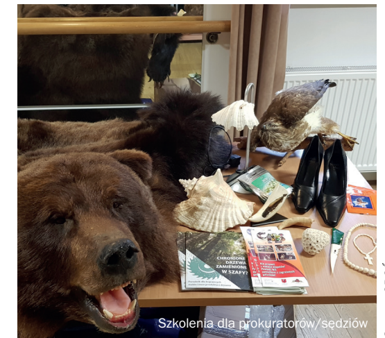
Szkolenia dla prokuratorów/sędziów