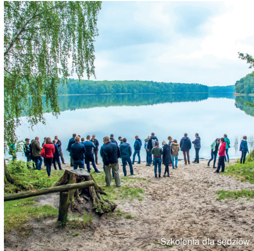
Szkolenia dla sędziów