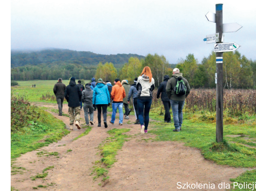
Szkolenia dla Policji

respect, and also to offer an insight into a scheme of actions to be taken in proceedings involving environmental offences and misdemeanours. Also, to offer an insight into possible offences that take place in legally protected areas, on the second day of the trainings, there were site visits to nearby national parks. A major benefit derived from the trainings was the ability to hear those with real-life experience, i.e. staff of regional environment protection directorates, regional directorates of national forests, voivodship environment protection inspectorates,