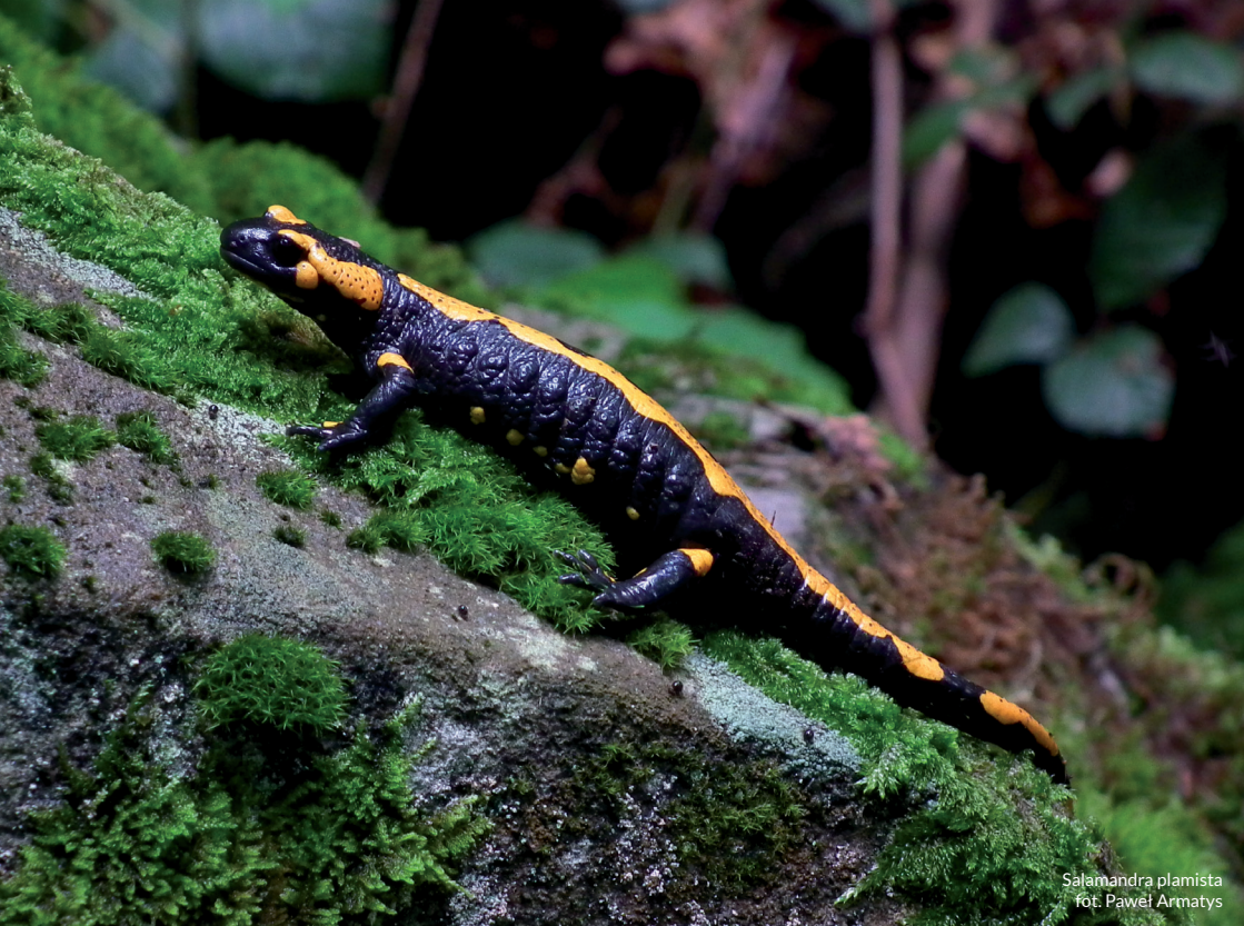
Salamandra plamista