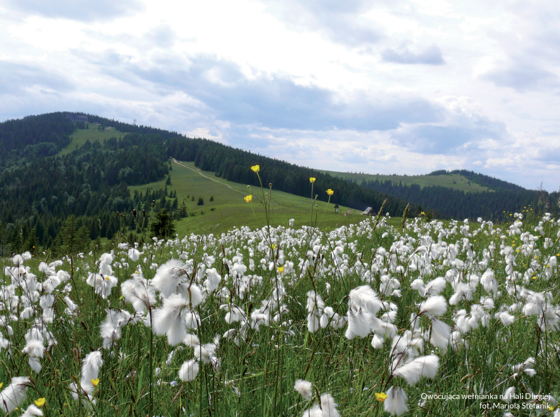
Owocująca wetniarka na Hali Długiej