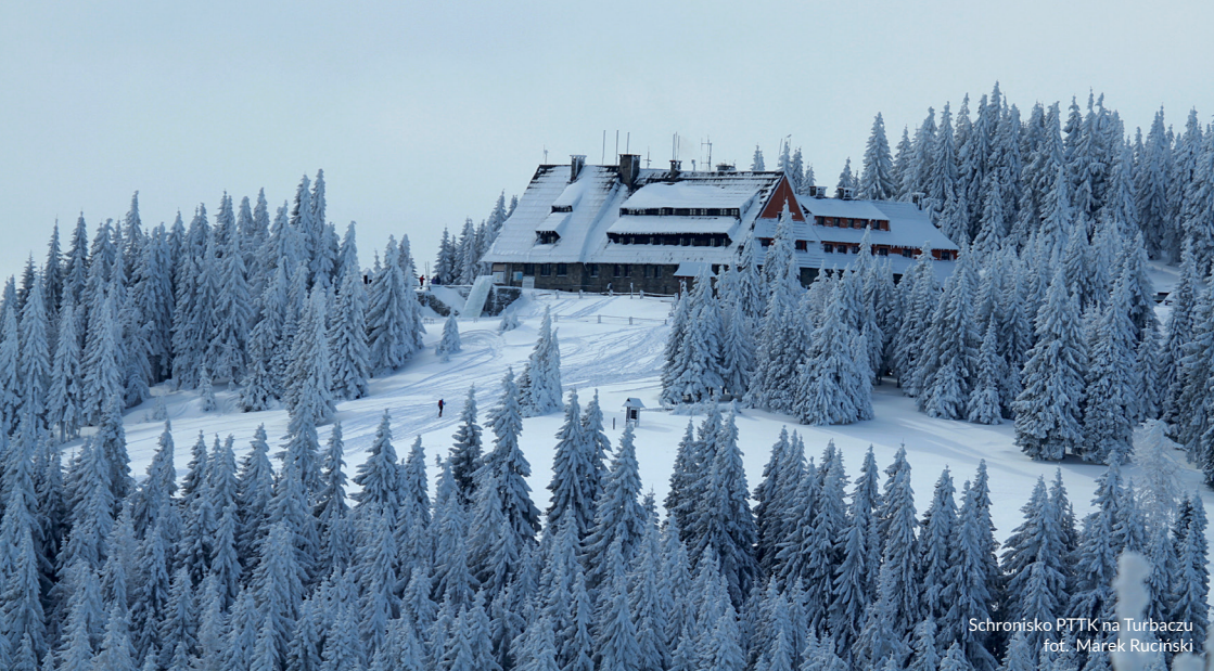
Schronisko PITK na Turbaczu