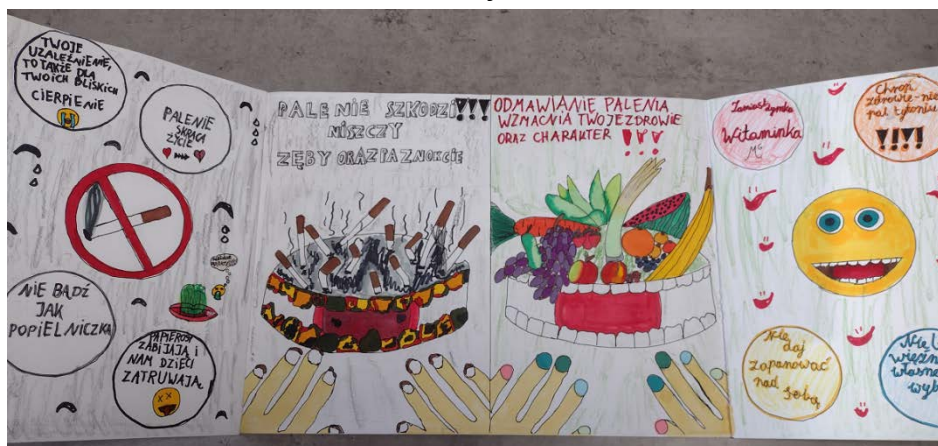
Paulina Pańczyk, klasa 4B, Szkoła Podstawowa w Przecławiu