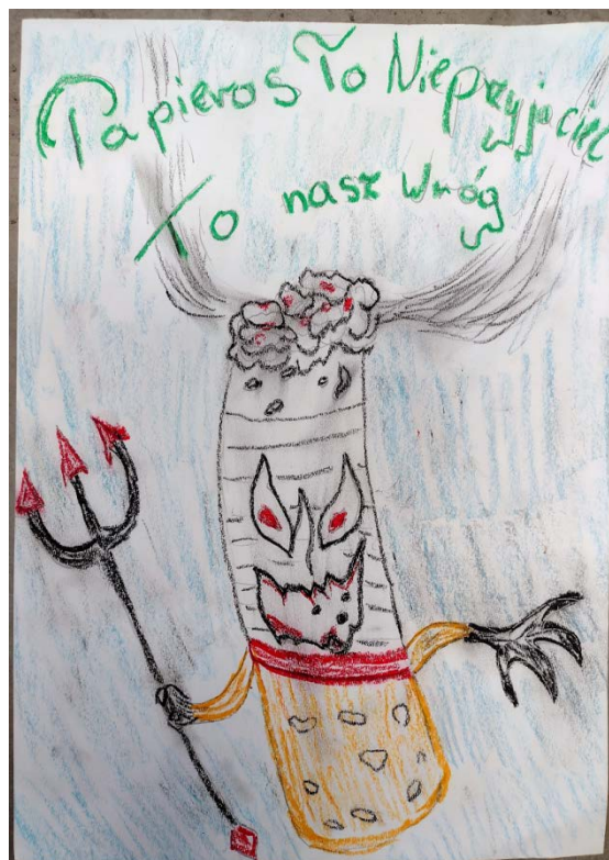
Gabriela Wieczorek, klasa 4, Szkoła Podstawowa nr 6 w Policach