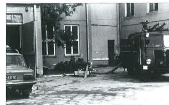
◆ Ćwiczenia ze sprzętem na placu przed komendą rejonową Straży Pożarnych w Sokołowie Podlaskim; początek lat 80.

Cztery lata wcześniej został oddany do użytku nowy budynek, wzniesiony przy strażnicy OSP w Sokołowie Podlaskim. Na parterze znajdowały się 2 boksy garażowe oraz dyżurka, na piętrze zaś – 3 pomieszczenia dla potrzeb powiatowej komendy Straży Pożarnych. Pracę przy jego powstaniu prowadzono w systemie gospodarczym, natomiast koszty w znacznej części pokryte zostały przez PZU. Z czasem, ze względu na sukcesywny wzrost zatrudnienia i zwiększającą się ilość sprzętu ratowniczego okazało się, iż istniejące zaplecze magazynowo-biurowe jest zbyt szczupłe. Dlatego podjęto decyzję o kolejnej rozbudowie strażnicy przy ul. Lipowej. Miała ona miejsce w latach 1971–74. Powstał