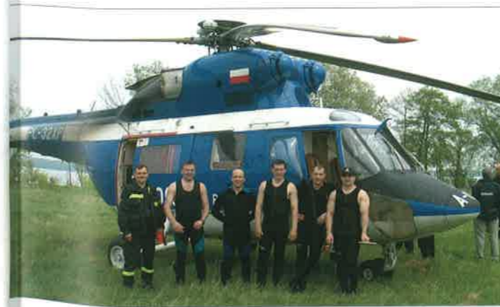
◆ Ćwiczenia grupy wodno-nurkowej z udziałem śmigłowca; 2003 rok.

Na mocy nowej ustawy o ochronie przeciwpożarowej, 1 lipca 1992 roku powołano Państwową Straż Pożarną. Nie była to tylko formalna zmiana