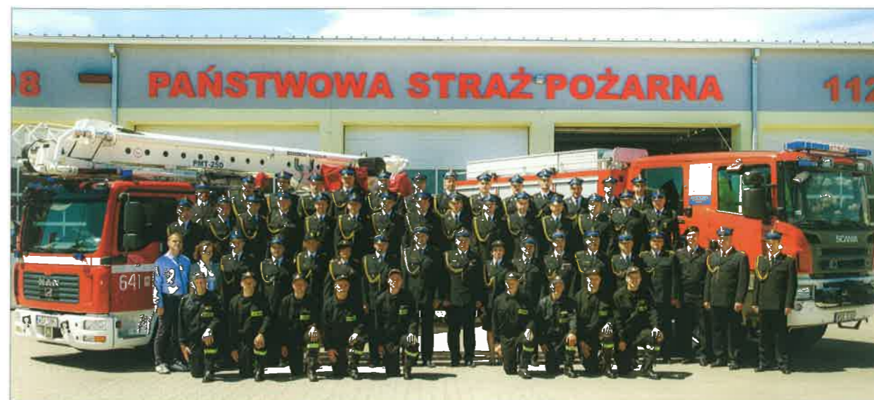
◆ Pracownicy komendy powiatowej PSP w Sokołowie Podlaskim; 2014 rok.