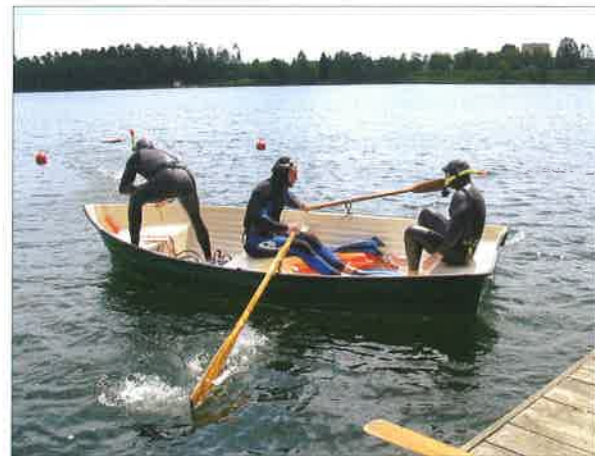
◆ VI Mazowieckie Zawody Strażaków Płetwonurków w Augustowie, na których strażacy z Sokołowa drużynowo wywalczyli I miejsce; 16 czerwca 2005 roku.

Zwiększona ilość obowiązków musiała wiązać się z dodatkowym dosprzętowaniem sokołowskiej PSP, ale również poprawą bazy lokalowej. Dzięki środkom pozyskanym z Komendy Głównej PSP, przystąpiono do rozbudowy straźnicy w latach 1993-94. Prace obejmowały zabudowę tarasu i dobudowanie stanowiska garażowego wraz piętrem. Pozyskano w ten sposób 75 m 2 powierzchni administracyjno-socjalnej, a także 40 m 2 – garażowej. W nowych pomieszczeniach urządzono Rejonowe Stanowisko Kierowania, 2 sypialnie, pokój dowódców JRG, zaplecze kuchenne, szatnię, archiwum oraz ześlizg, którego dotąd nie było. Duży wkład w tę inwestycję mieli tutejsi strażacy, wykonując społecznie prace