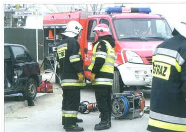
◆ Ćwiczenia z zakresu ratownictwa drogowego na ul. Ząbkowskiej w Sokołowie Podlaskim; listopad, 2012 rok.

Podkreślić należy, że w obiekcie miały znaleźć się nie tylko pomieszczenia dla Komendy i Jednostki Ratowniczo-Gaśniczej PSP, ale również Powiatowego Centrum Zarządzania Kryzysowego z obsługą alarmowego numeru 112 i dwóch zespołów wyjazdowych ratownictwa medycznego. W projekcie uwzględniono też wieżę zawierającą w sobie krytą wspinacznicę – jedną z nielicznych w kraju i jedyną w województwie mazowieckim. Powierzchnia garażowa miała wynosić 850 m 2 . Dla porównania, w starym budynku samochody parkowały na 350 m 2 . Podsumowując, w budowanej strażnicy miały zostać spełnione wszelkie standardy i normatywy, a zastosowane rozwiązania miały być bardzo nowoczesne, na miarę XXI wieku.