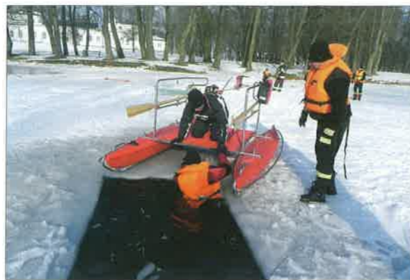
◆ Sokołowscy strażacy podczas doskonalenia z zakresu ratownictwa lodowego, z wykorzystaniem systemu woda-łód oraz deski lodowej na zbiorniku wodnym w Sokołowie Podlaskim; 2015 rok.