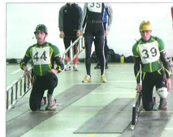
◆ Zawody w dwuboju pożarniczym na obiektach komendy powiatowej PSP w Sokołowie Podlaskim; 2015 rok.

Na wyposażeniu komendy powiatowej PSP oraz Jednostki Ratowniczo-Gaśniczej aktualnie znajdują się: pojazdy ratowniczo-gaśnicze – Iveco Daily-661 GLBA 1/1+ Rt, Star-Man GBA 2,5/27, Star-Man 6x6 GBA 2,5/20, Scania P400 CP 28 4x4 GCBA 5/36/2,8, ciągnik siodłowy DAF GCBM 18/13, naczepa cysterna 18 m 3 ; samochody specjalne – Man TGL 12.240 4x2 SHD-25, Man LE 14.280 4x4 SRW, Toyota Hilux SLRR, Volkswagen Crafter (mobilne stanowisko kierowania), Toyota Verso SLOp, Ford Mondeo SLOp, Volkswagen Caddy SLKw; sprzęt pływający – pneumatyczna łódź motorowa z dnem laminowanym RIB 600 z silnikiem