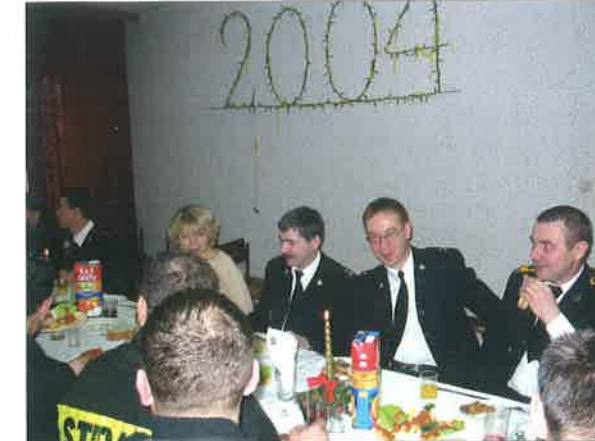
◆ Strażacka wigilia; 2004 rok.