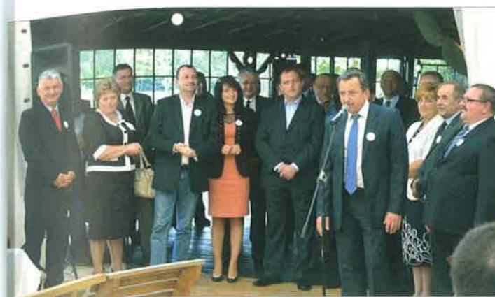
◆ Wspólne spotkanie w Sterdynie partnerów projektu pn. „Rozwój potencjału służb ratowniczych Polska – Ukraina” w ramach wzmacniania infrastruktury transgranicznego systemu zarządzania zagrożeniami naturalnymi” oraz przedstawicieli beneficjenta, którym było Starostwo Powiatowe w Sokołowie Podlaskim; Sterdyń, 5 czerwca 2013 roku.