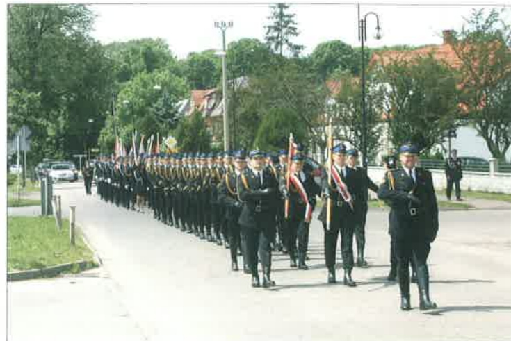
◆ Przemarsz strażaków z PSP i OSP podczas uroczystości otwarcia nowej strażnicy; 31 maja 2014 roku.