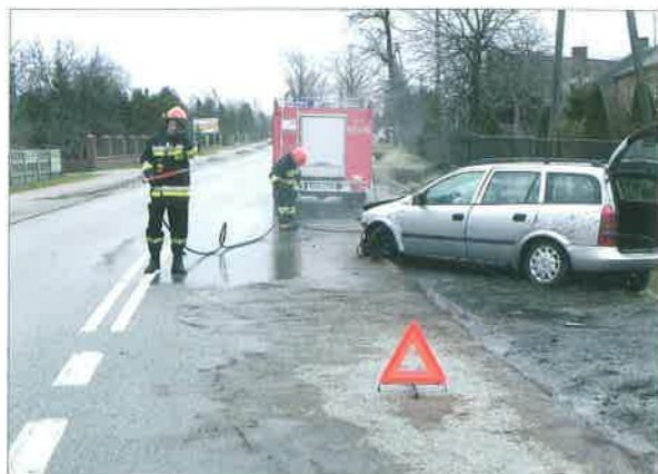
◆ Akcja ratownicza po wypadku samochodowym w Brzozowie; 2014 rok.

stwo Powiatowe w Sokołowie Podlaskim. Komenda Powiatowa PSP w Sokołowie Podlaskim oraz strażacy z Łucka zostali partnerami projektu.