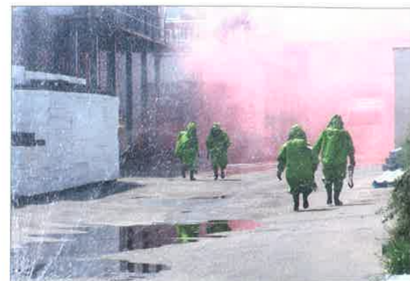
◆ Ćwiczenia z ratownictwa chemicznego w zakładzie „Real” w Morszkowie; 29 czerwca 2007 roku.