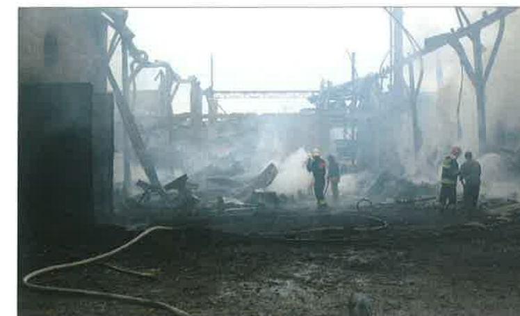
◆ Pożar tartaku w Niecieczy; 2009 rok.

Wprowadzona 1 stycznia 1999 roku reforma administracyjna kraju, spowodowała likwidację województwa siedleckiego i w ślad za tym komendy wojewódzkiej PSP w Siedlcach. Po 24 latach ponownie przywrócono powiaty, w tym powiat sokołowski. Tutejsza komenda rejonowa PSP stała