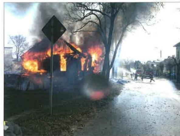
◆ Pożar drewnianego budynku przy ul. Siedleckiej w Sokołowie Podlaskim; 24 czerwca 2012 roku.