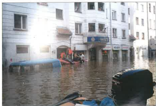
◆ Grupa wodno-nurkowa z Sokołowa Podlaskiego w akcji ratowniczej podczas powodzi we Wrocławiu; 1997 rok.

Pomimo rozbudowy, jaka miała miejsce w latach 70. znajdująca się w centrum miasta strażnica nie zapewniała dogodnych warunków pracy. Strażacy odpoczywali w jednym dużym pomieszczeniu, w którym jednocześnie mieściło się stanowisko kierowania. Zaplecze kuchenne urządzone było natomiast w świetlicy, którą przedzielono szafkami na ubrania. Wobec takiej sytuacji, jednym z prioryteto-