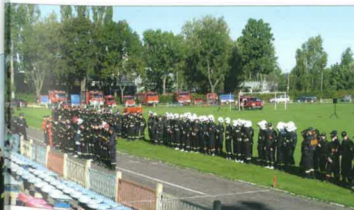
◆ Powiatowe zawody sportowo-pożarnicze w Sokołowie Podlaskim; 2009 rok.