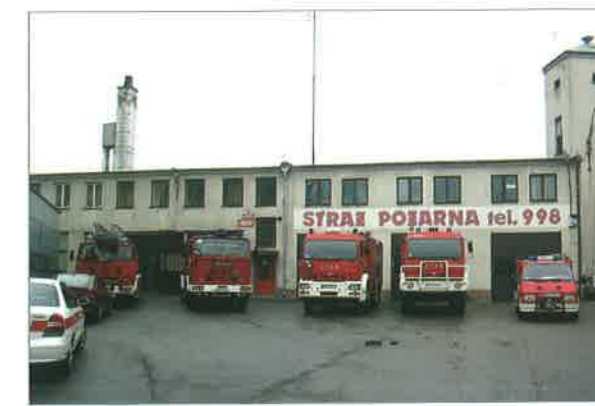
◆ Siedziba PSP w Sokołowie Podlaskim przy ul. Lipowej; 2005 rok.

Tuż po wprowadzonej reformie, w sierpniu 1992 roku zastęp JRG wraz z 3 zastępami OSP pospieszili