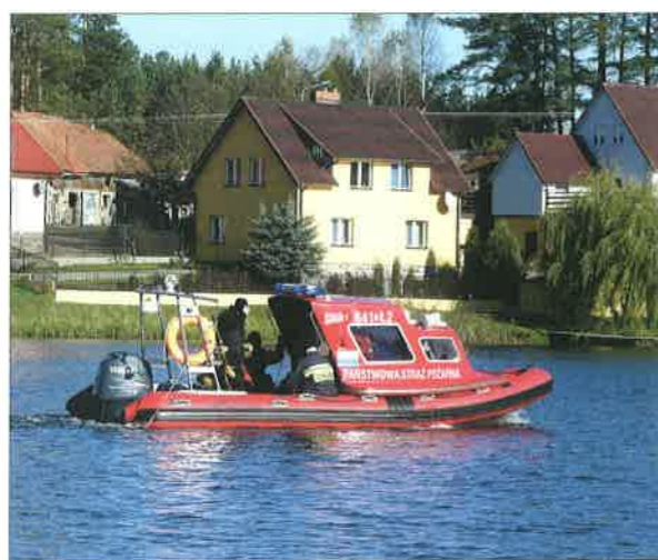
◆ Szkolenie z zakresu obsługi sonarów – Pasyem koło Szczyt- na; 2010 rok.

Dotacje państwowe oraz fundusze przekazane przez: Starostwo Powiatowe w Sokołowie Podlaskim, Wojewódzki Urząd Marszałkowski w Warszawie, Wojewódzki Fundusz Ochrony Środowiska i Gospodarki Wodnej w Warszawie, Narodowy Fundusz Ochrony Środowiska i Gospodarki Wodnej, samorząd Sokołowa Podlaskiego oraz firmy ubezpieczeniowe umożliwiły doposażenie komendy PSP m.in. w samochody: ratowniczo-gaśniczy Star M-78 GBA 2,5/27 z dwuzakresową autopompą i uterenowionym napędem; ratowniczo-gaśniczy Star M-90 GBA 2/20 z dwuzakresową autopompą; Ford z wyposażeniem do ratownictwa drogowego,