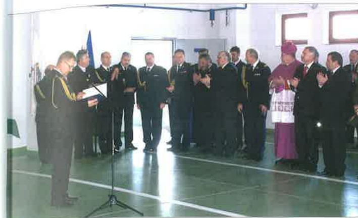
◆ Oficjalne otwarcie części strażnicy przeznaczonej dla JRG; 2008 rok.

nież 13 zestawów osobistego sprzętu nurkowego, a także sonary: opuszczany Imagenex 881L i boczny Edgetech 4125.