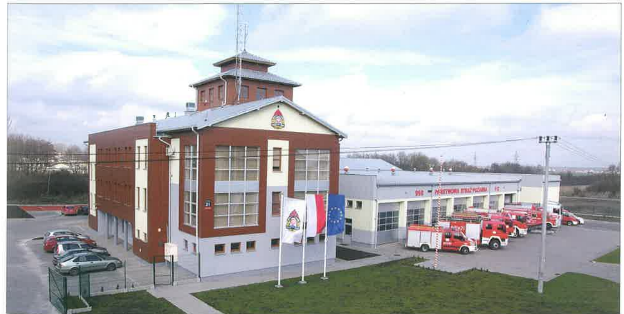
◆ Strażnica PSP w Sokołowie Podlaskim; 2014 rok.

Determinacja nowego komendanta oraz podjęte działania w tym zakresie zaowocowały szybkim pozyskaniem dotacji z Ministerstwa Spraw Wewnętrznych i Administracji oraz środków ubezpieczenio-