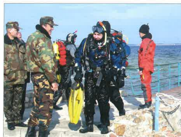
◆ Wspólne ćwiczenia z ratownictwa wodnego ze strażakami z Ukrainy na Jeziorze Świtez; 24 października 2007 roku.

Aktualny stan wyszkolenia grupy przedstawia się następująco: 6 osób posiada uprawnienia nurka MSWiA z prawem do kierowania pracami podwodnymi, 1 – nurka MSWiA, 10 – młodszego nurka MSWiA i 4 – pletwonurka. Dysponują oni samochodem Man SRw z 2001 roku, łodzią płaskodenną Quicksilver, pneumatyczną łodzią motorową RIB-600 wraz z silnikiem Honda BF-90, 2 łodziami bez napędu silnikowego oraz łodzią pneumatyczną kabinową RIB-690 z silnikiem o mocy 150 KM. Poza sprzętem pływającym, do ich dyspozycji jest rów-