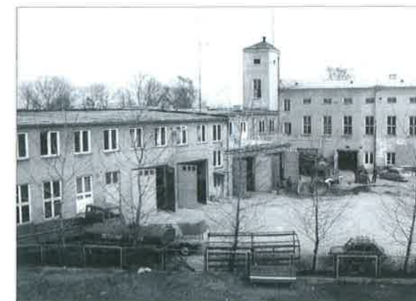
◆ Siedziba komendy rejonowej Straży Pożarnych w Sokołowie Podlaskim po rozbudowie; lata 80.