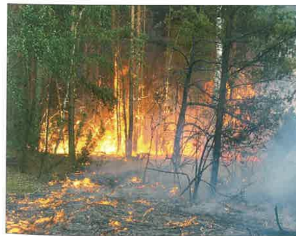
◆ Pożar w kompleksie leśnym Maliszewa; 2011 rok.

Przygotowany dokument został skonsultowany z pracownikami komendy i JRG, a po jego zatwier-