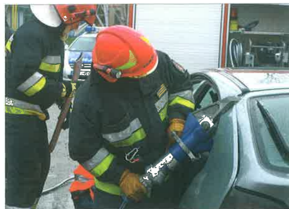
◆ Pokazy ratownictwa technicznego podczas Finału Wielkiej Orkiestry Świątecznej Pomocy w Sokołowie Podlaskim; styczeń, 2012 rok.

Taka sytuacja spowodowała, że inwestycja została podzielona na etapy. W pierwszej kolejności zdecydowano się wykonać siedzibę JRG, a pozostałą część budynku wystawić w stanie surowym zamkniętym. Prace zostały sfinansowane w znacznym stopniu ze środków Europejskiego Funduszu Rozwoju Regionalnego, a także „Programu Sąsiedztwa Polska – Białoruś – Ukraina INTER-REG IIIA/TACIS CBC”. Jego realizacja była m.in. możliwa dzięki współpracy podjętej ze strażakami z Szacka. Było to jedno z pierwszych przedsięwzięć w mieście, a także w strukturach PSP województwa mazowieckiego, realizowane ze środków unijnych.