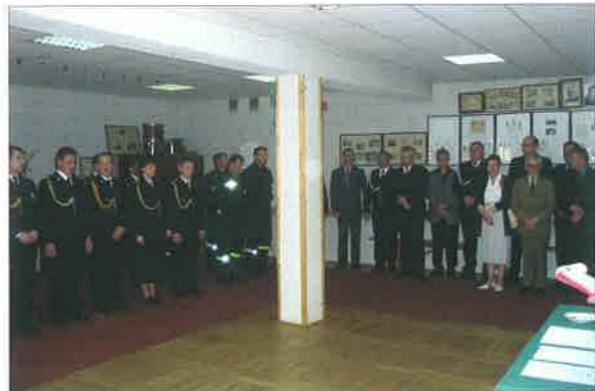
◆ Obchody Dnia Strażaka w świetlicy komendy PSP przy ul. Lipowej; 2003 rok.

wych celów komendanta Józefa Panasza była poprawa warunków socjalno-bytowych załogi. Brak aktu własności do zajmowanego obiektu, stanowił formalno-prawną przeszkodę uniemożliwiającą duże inwestycje. Można było ograniczać się jedynie do prowadzenia bieżących remontów, na co pozwalała umowa najmu zawarta z OSP. Pomimo problemów finansowych, kierownictwo komendy kilkakrotnie podejmowało inicjatywę zmierzającą do poprawy warunków jej funkcjonowania. Pomimo tego, nie były one idealne i dalekie od wymogów BHP.