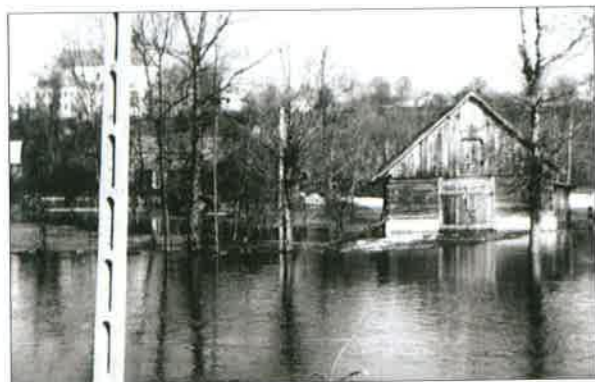
◆ Powódź w rejonie sokołowskim spowodowana wystąpieniem z brzegów Bugu; wiosna, 1980 rok.

Ówczesne OSP typu S wyposażone były w samochody ze zbiornikiem na wodę, należały do nich m.in. jednostki z Kosowa Lackiego, Repek, Jabłonny Lackiej, Ceranowa i Sokołowa Podlaskiego. Powszechne typy samochodów bojowych to: Star-21, Star-25, Lublin-51.