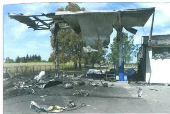
◆ Stacja paliw w Sokołowie Podlaskim po wybuchu gazu; 2015 rok.