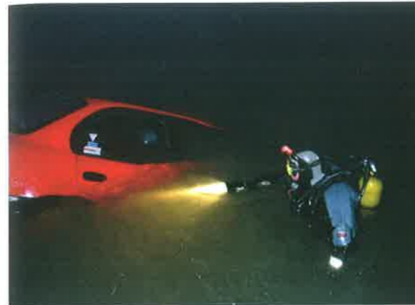
◆ Strażacy z grupy wodno-nurkowej podczas nocnej akcji ratowniczej w Porębach Nowych (powiat miński); 14 maja 2003 roku.

W 1990 roku kadra została wzmocniona poprzez zatrudnienie dwóch absolwentów Szkoły Głównej Służby Pożarniczej – ppor. poż. Tomasza Wilka i ppor. poż. Sławomira Lipkę.