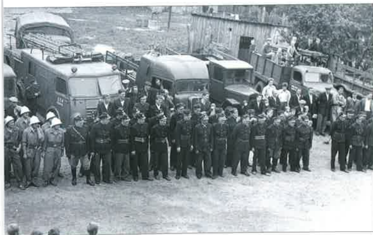
◆ Zawody pożarnicze w Repkach; 1962 rok.

Już w kilka miesięcy po zakończeniu II wojny światowej, władze państwowe starały się usystematyzować ochronę przeciwpożarową w Polsce,