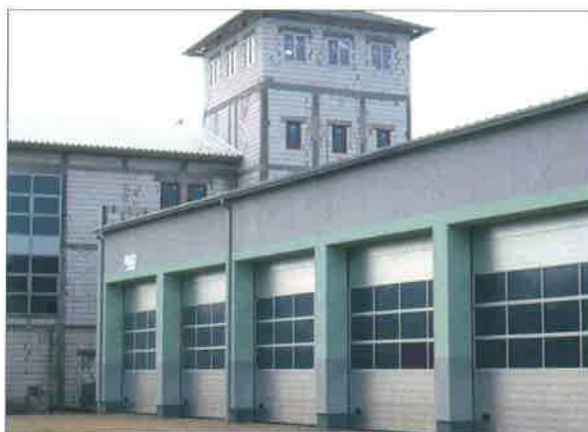
◆ Siedziba PSP w Sokołowie Podlaskim po zakończeniu pierwszego etapu budowy; listopad, 2007 rok.

Członkowie zespołu regularnie uczestniczą w ćwiczeniach, odbywających się nie tylko na pobliskiej rzece Bug, ale również innych zbiornikach wodnych w Polsce i na Ukrainie. Do chwili obecnej wodniacy przeprowadzili ponad 300 akcji, z czego