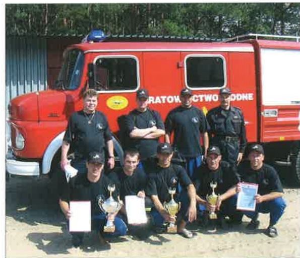
◆ Reprezentacja komendy powiatowej PSP Sokołów Podlaski po IV Mazowieckich Zawodach Strażaków Płetwonurków w Gorzewie; 17 czerwca 2003 roku.

W drugiej połowie lat 80. Zawodowa Straż Pożarna wzbogaciła się o używany podnośnik SH-18 na podwoziu Stara-200, samochód dowodzenia i łączności Żuk, pojazd przeciwgazowo-dymowy Żuk, cysterne z ciągnikiem siodłowym marki Jelcz do przewozu wody GCBM 18/8.