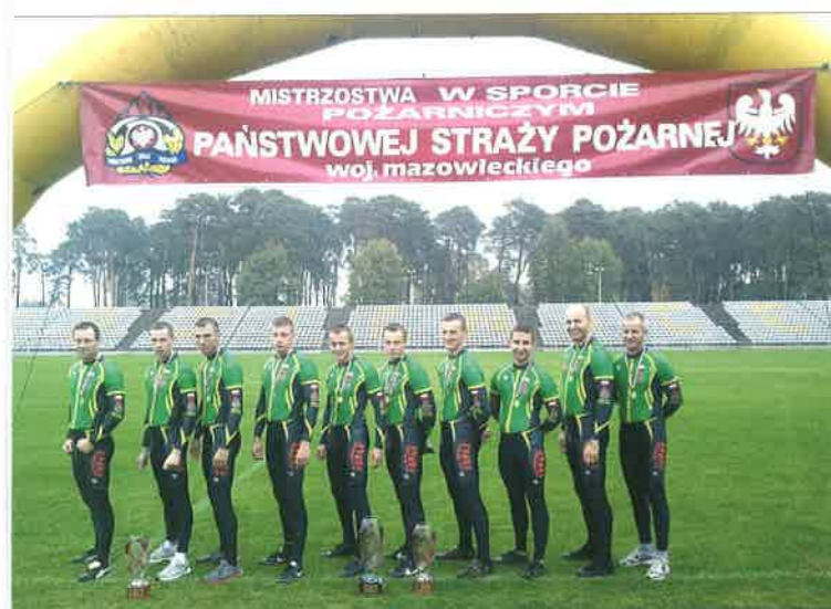
◆ Reprezentacja komendy powiatowej PSP w Sokołowie Podlaskim (w środku) po wywalczeniu I miejsca na Mistrzostwach w Sporcie Pożarniczym PSP województwa mazowieckiego w Kozienicach; 2012 rok.

Taka sytuacja spowodowała, że inwestycja została podzielona na etapy. W pierwszej kolejności zdecydowano się wykonać siedzibę JRG, a pozostałą część budynku wystawić w stanie surowym zamkniętym. Prace zostały sfinansowane w znacznym stopniu ze środków Europejskiego Funduszu Rozwoju Regionalnego, a także „Programu Sąsiedztwa Polska – Białoruś – Ukraina INTER-REG IIIA/TACIS CBC”. Jego realizacja była m.in. możliwa dzięki współpracy podjętej ze strażakami z Szacka. Było to jedno z pierwszych przedsięwzięć w mieście, a także w strukturach PSP województwa mazowieckiego, realizowane ze środków unijnych.