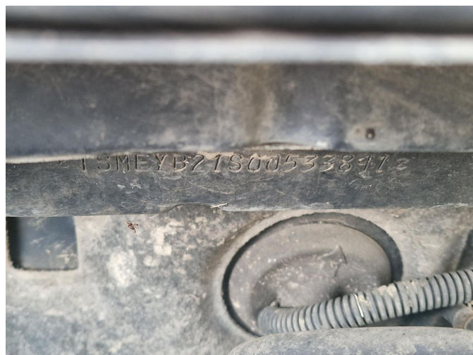
Dok. fot. z dnia 13.03.2023 fot. nr 12