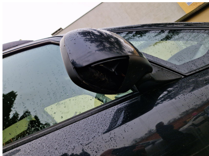
Dok. fot. z dnia 13.03.2023 fot. nr 22