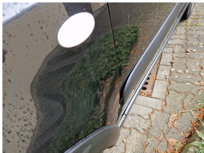
Dok. fot. z dnia 13.03.2023 fot. nr 24