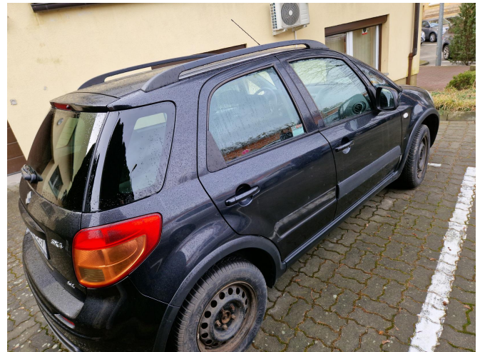
Dok. fot. z dnia 13.03.2023 fot. nr 4