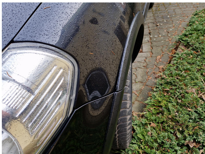
Dok. fot. z dnia 13.03.2023 fot. nr 23