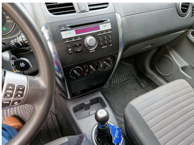
Dok. fot. z dnia 13.03.2023 fot. nr 15