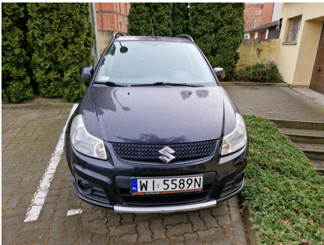
Dok. fot. z dnia 13.03.2023 fot. nr 5