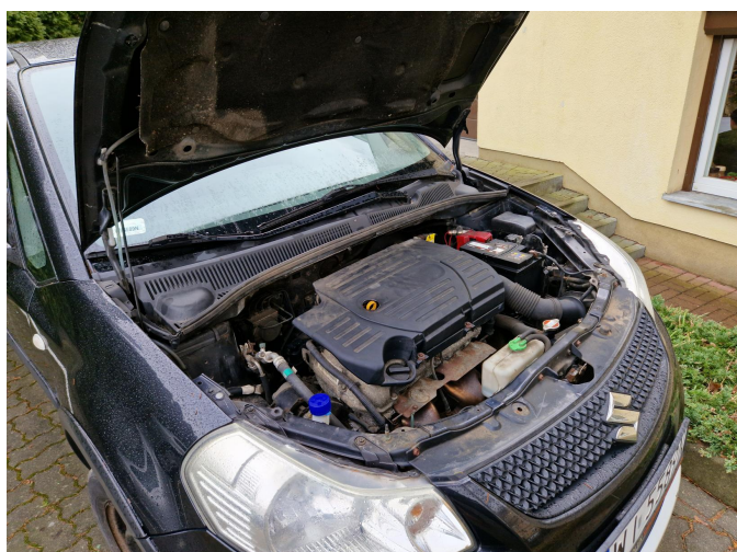
Dok. fot. z dnia 13.03.2023 fot. nr 17