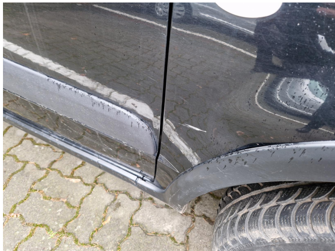
Dok. fot. z dnia 13.03.2023 fot. nr 19