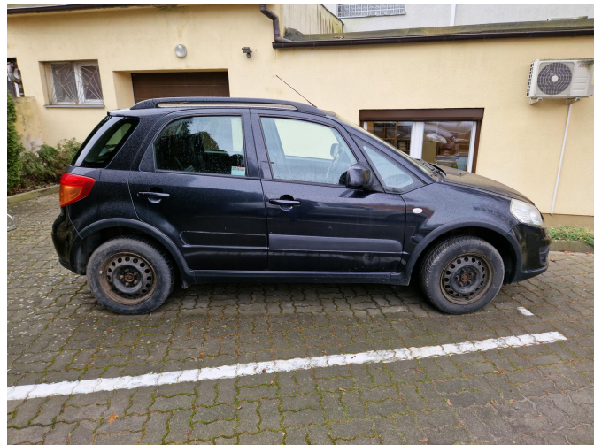
Dok. fot. z dnia 13.03.2023 fot. nr 8