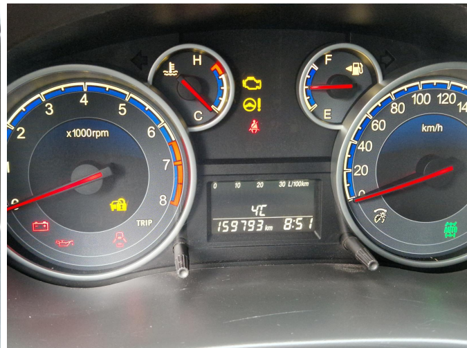
Dok. fot. z dnia 13.03.2023 fot. nr 14