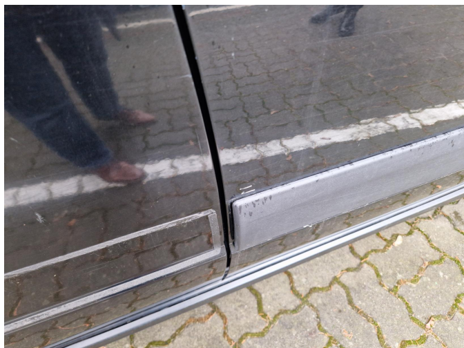
Dok. fot. z dnia 13.03.2023 fot. nr 21