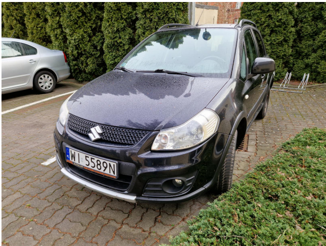
Dok. fot. z dnia 13.03.2023 fot. nr 3