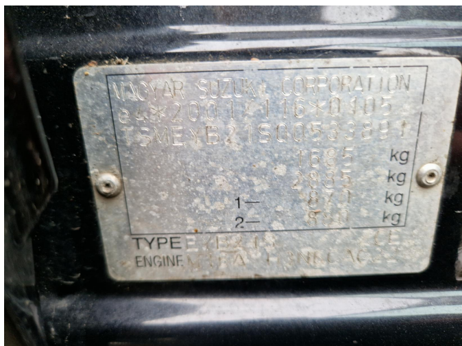
Dok. fot. z dnia 13.03.2023 fot. nr 11