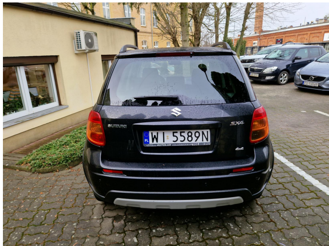
Dok. fot. z dnia 13.03.2023 fot. nr 7