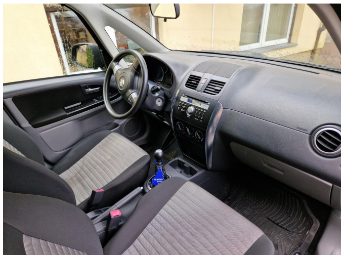
Dok. fot. z dnia 13.03.2023 fot. nr 9