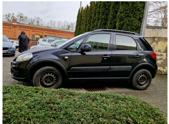
Dok. fot. z dnia 13.03.2023 fot. nr 6