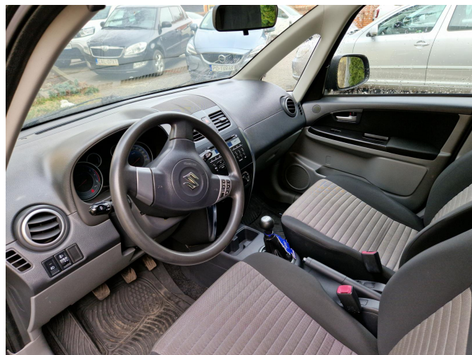
Dok. fot. z dnia 13.03.2023 fot. nr 10