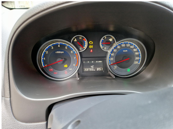
Dok. fot. z dnia 13.03.2023 fot. nr 13