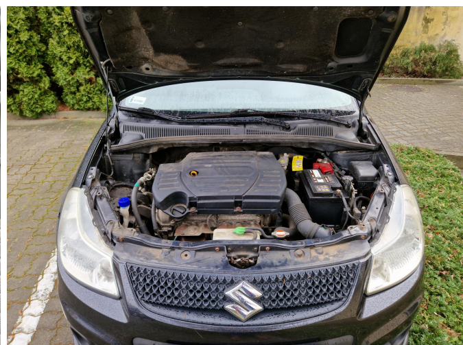
Dok. fot. z dnia 13.03.2023 fot. nr 16