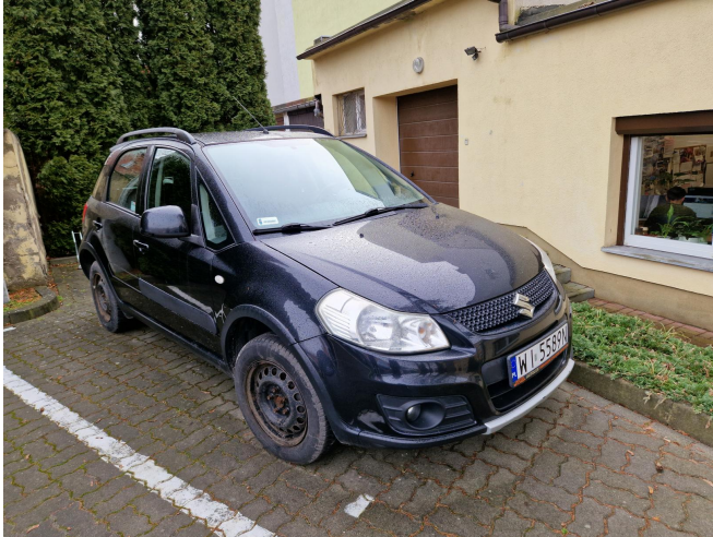
Dok. fot. z dnia 13.03.2023 fot. nr 1