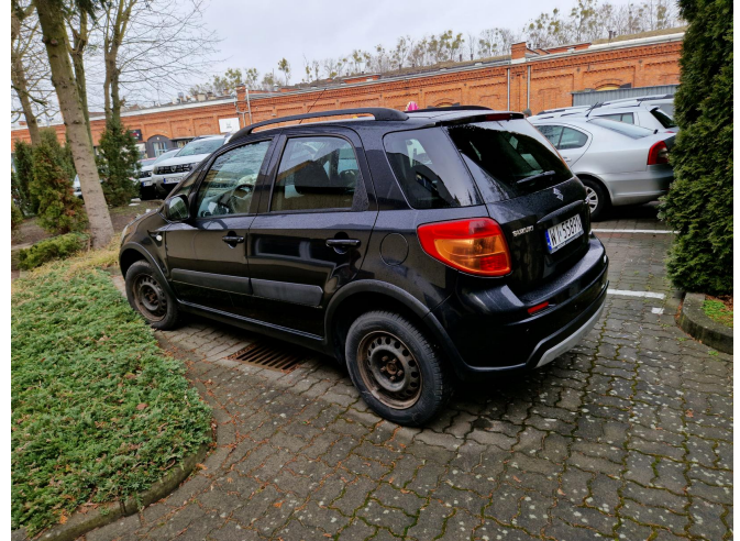
Dok. fot. z dnia 13.03.2023 fot. nr 2