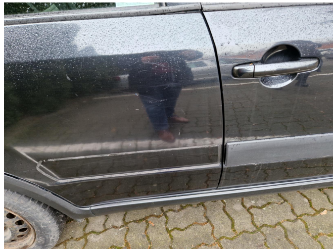
Dok. fot. z dnia 13.03.2023 fot. nr 20