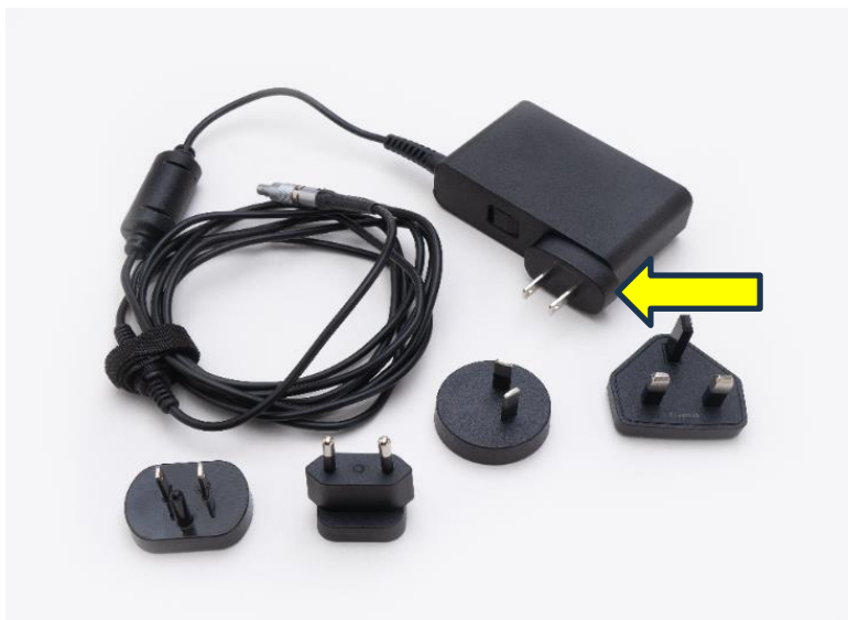
Figure 1: CADD- Solis AC Adapter

Wtyczka zasilacza AC, zaznaczona na poniższym rysunku 1, może ulec uszkodzeniu lub pęknięciu. Jeśli wtyczka wejściowa jest uszkodzona, metalowe styki do korpusu zasilacza AC mogą być odsonięte lub jeden albo więcej bolców sieciowych AC może odłączyć się od wtyczki.