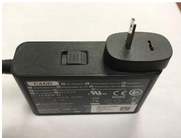
Figure 3: AC Adapter with Missing AC Prong