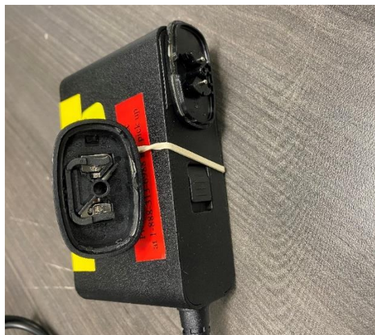
Figure 2: Damaged Input Plug