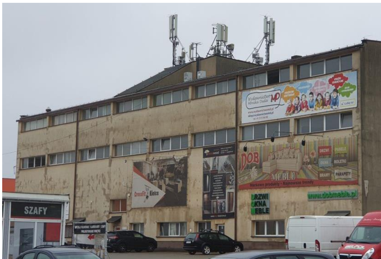
Fot. 1: Widok anten stacji bazowych: ID: KIE1016_C oraz ID: 55315 (27315), zlokalizowanych pod adresem: ul. Zagnańska 71, 25-558 Kielce