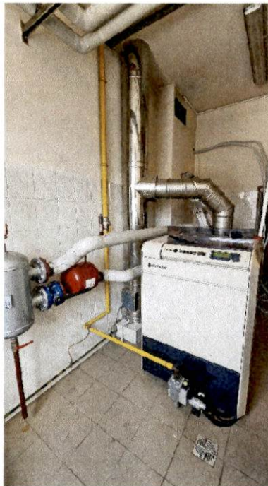
Rys. 1. Istniejący kocioł gazowy znajdujący się w kotłowni

Przedmiotem zamówienia jest „Wymiana istniejącego kotła gazowego z osprzętem w Prokuraturze Okręgowej w Radomiu”