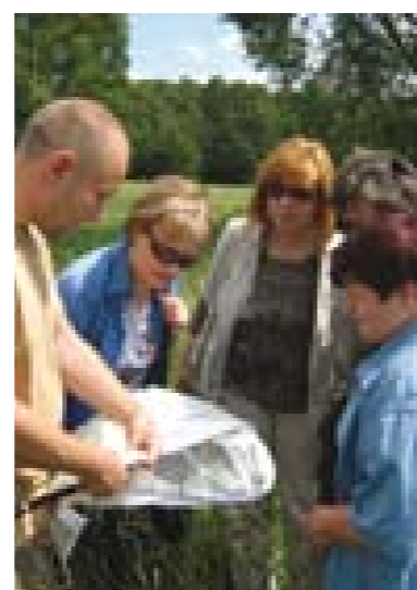
Ochrona i poprawa jakości siedlisk rzadkich motyli podmokłych łąk półnaturalnych.

W naborze 2007 dofinansowanie Komisji Europejskiej uzyskał projekt pn. „Rekultywacja Jezior Jelonek i Winiary metodą inaktywacji fosforu w osadach dennych” złożony przez Miasto Gniezno.