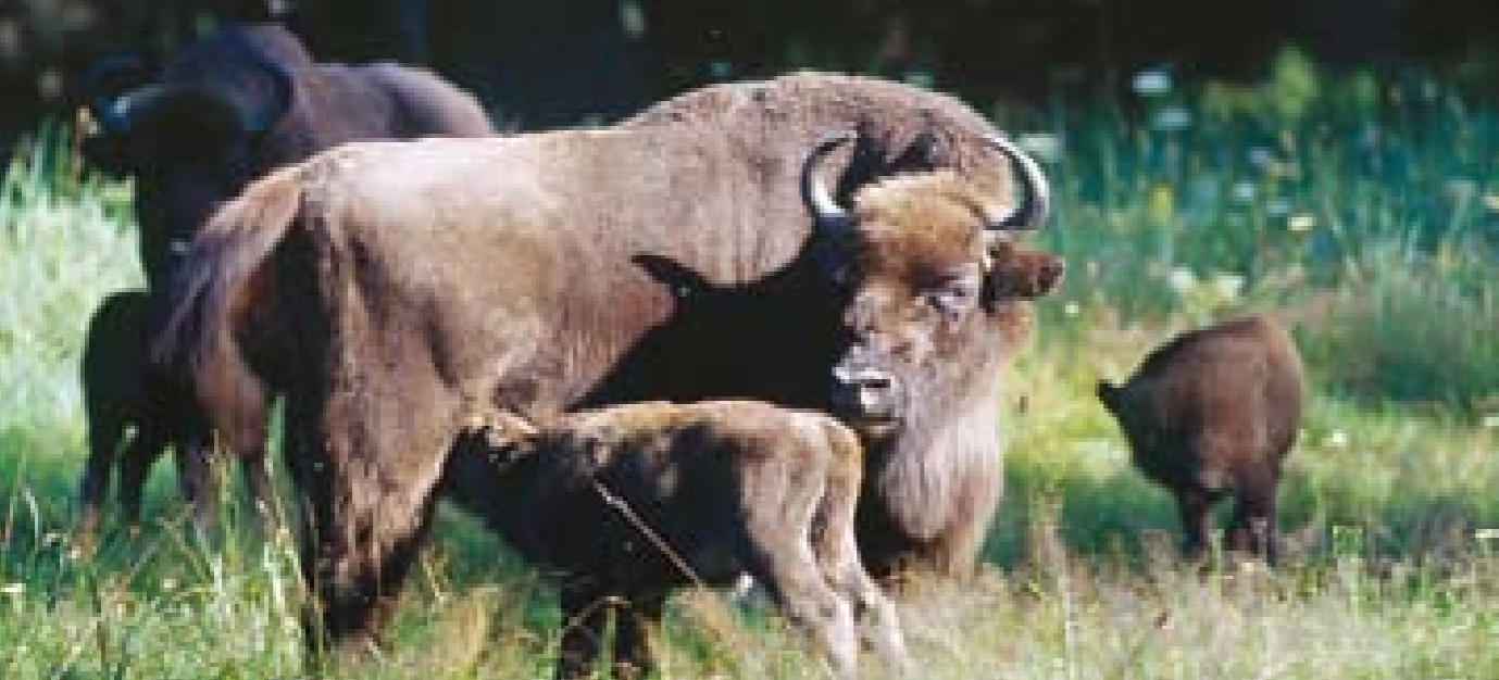
Ochrona żubra w Puszczy Białowieskiej.