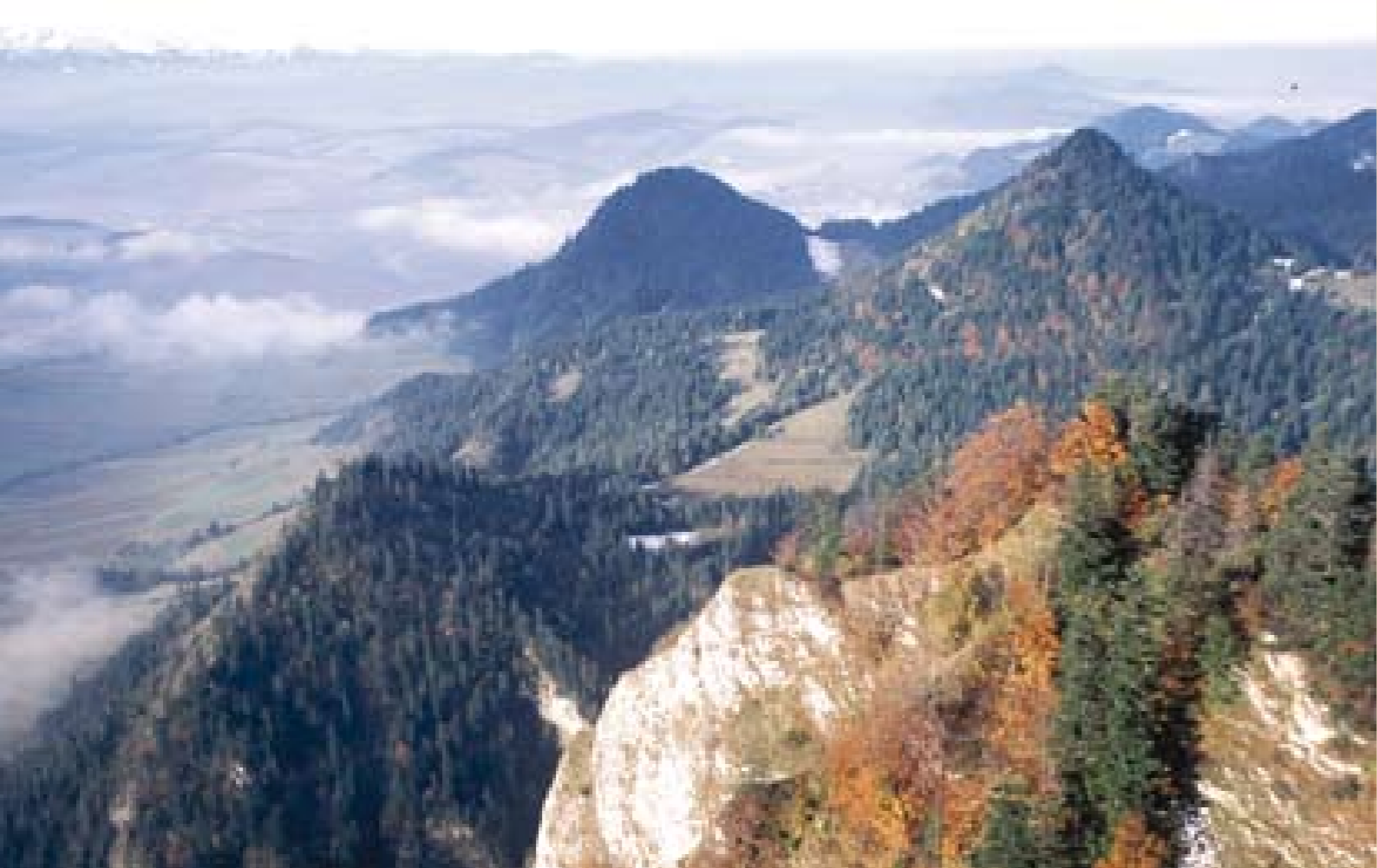
Panorama z Trzech Koron w Pieninach.

Fundusz LIFE+ jest jedynym instrumentem finansowym Unii Europejskiej koncentrującym się wyłącznie na współfinansowaniu projektów w dziedzinie ochrony środowiska. Jego głównym celem jest wspieranie procesu wdrażania wspólnotowego prawa ochrony środowiska, realizacja polityki ochrony środowiska oraz identyfikacja i promocja nowych rozwiązań dla problemów dotyczących ochrony przyrody. Program LIFE+ podzielony jest na trzy komponenty tematyczne: przyroda i różnorodność biologiczna, polityka i zarządzanie w zakresie środowiska oraz informacja i komunikacja.