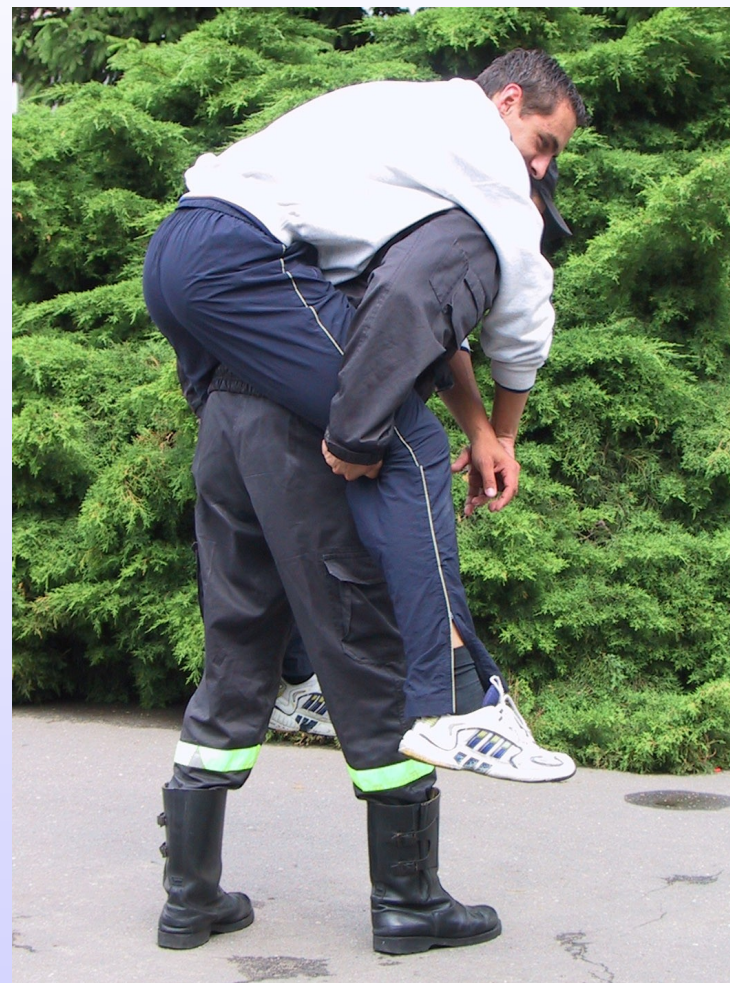
Chwyt „na barana”