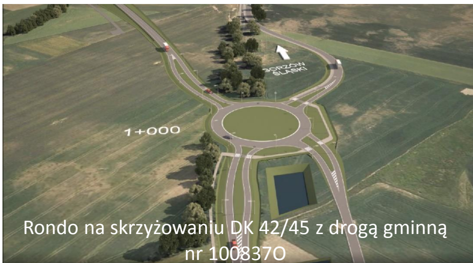
Rondo na skrzyżowaniu DK 42/45 z drogą gminną nr 1008370