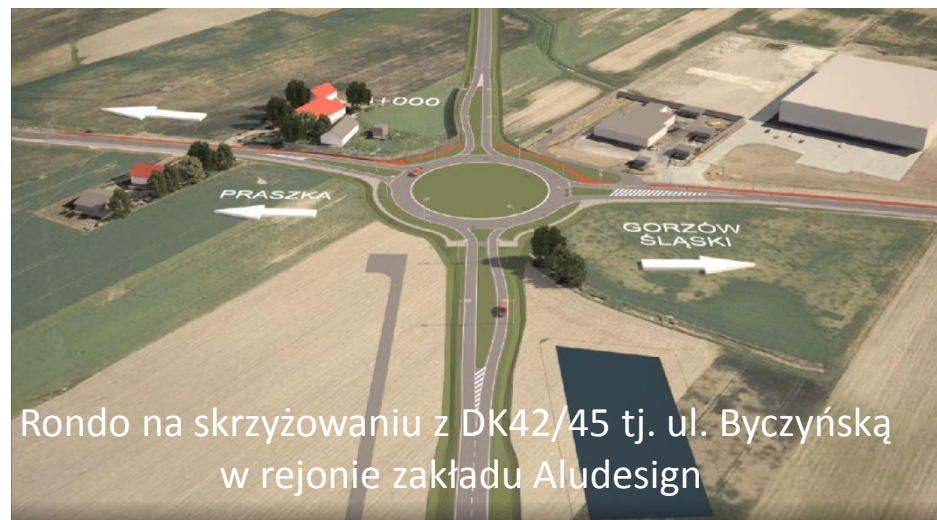
Rondo na skrzyżowaniu z DK42/45 tj. ul. Byczyńską w rejonie zakładu Aludesign