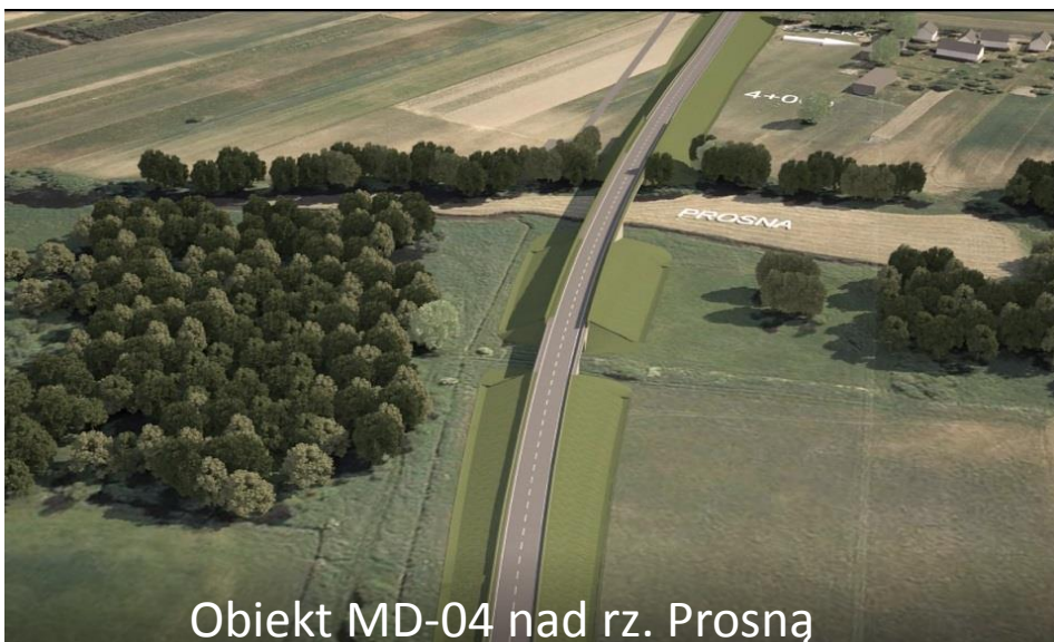
Obiekt MD-04 nad rz. Prosną