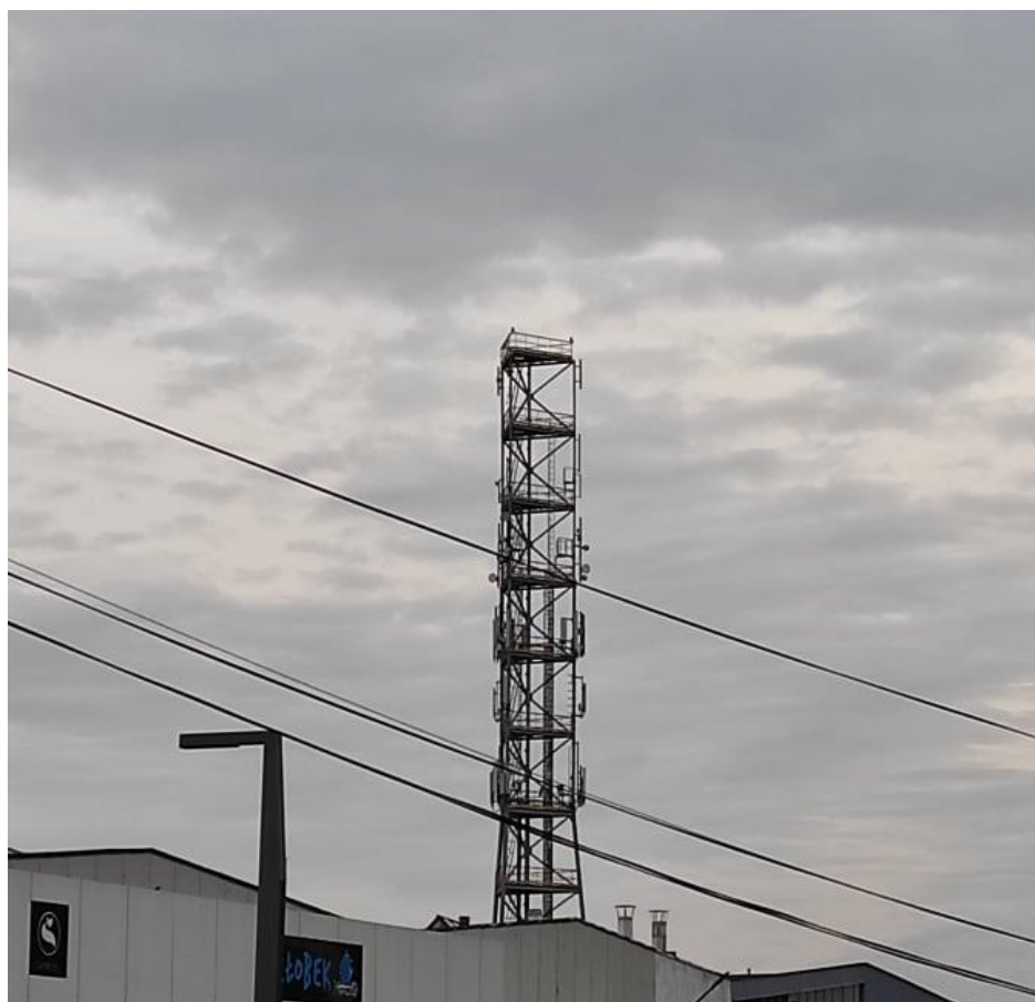
Fot. 1: Widoki anten stacji bazowych: ID: BT43612 oraz ID: 1189, zlokalizowanych: ul. Łukasińskiego 110, Szczecin