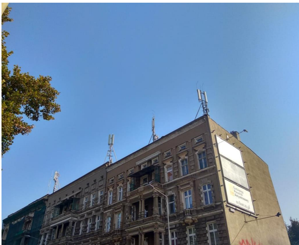
Fot. 1: Widok anten stacji bazowych: ID: SZC1019_E, ID: BT41715, zlokalizowanych pod adresem: ul. Matejki 6-6a, 71-615 Szczecin