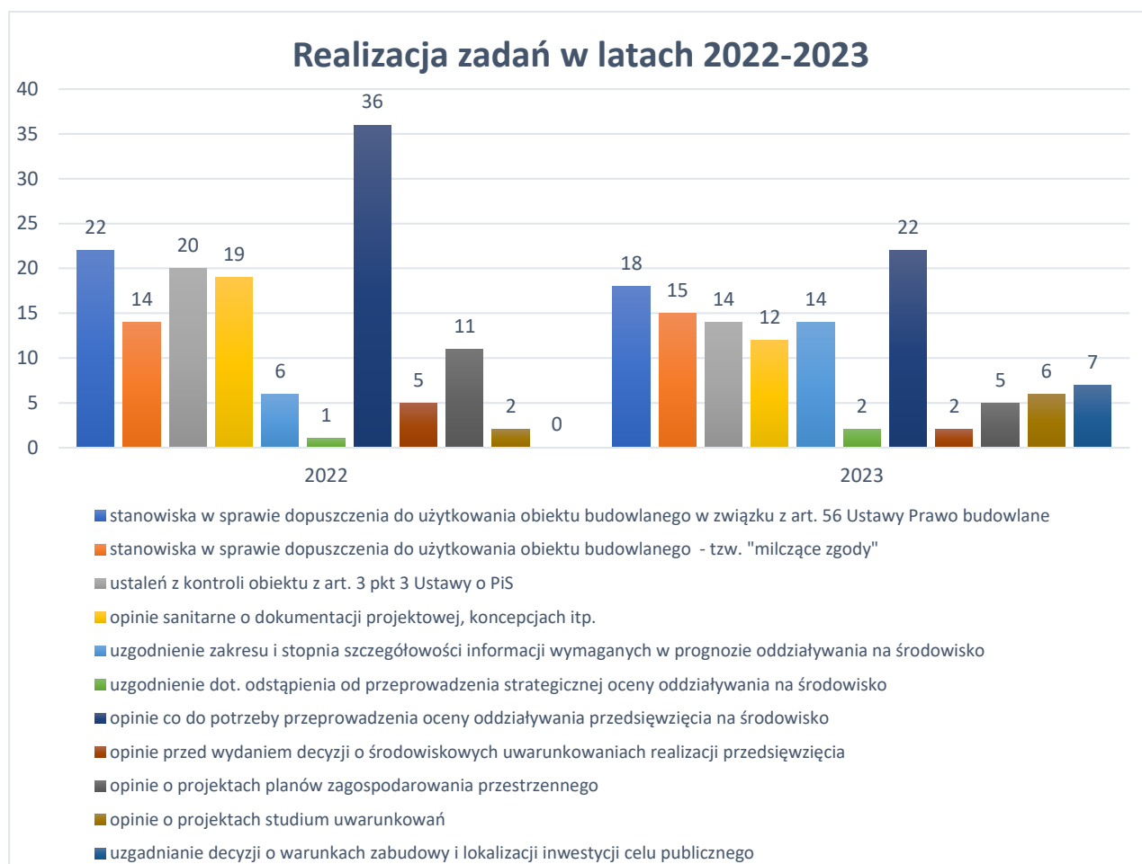
Tabela 1 Realizacja zadań w latach 2022-2023