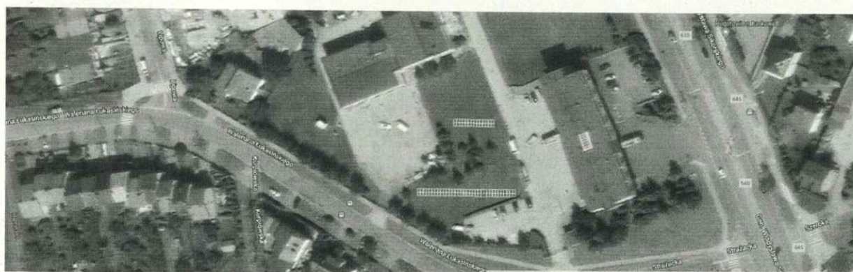
Rozmieszczenie instalacji fotowoltaicznej na gruncie

Instalacja fotowoltaiczna ma powstać na gruncie na terenie Komendy Miejskiej Państwowej Straży Pożarnej w Łomży.