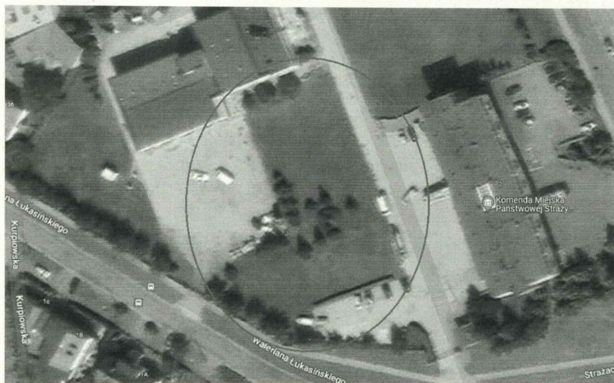
Lokalizacja obiektu do wykonania inwestycji.