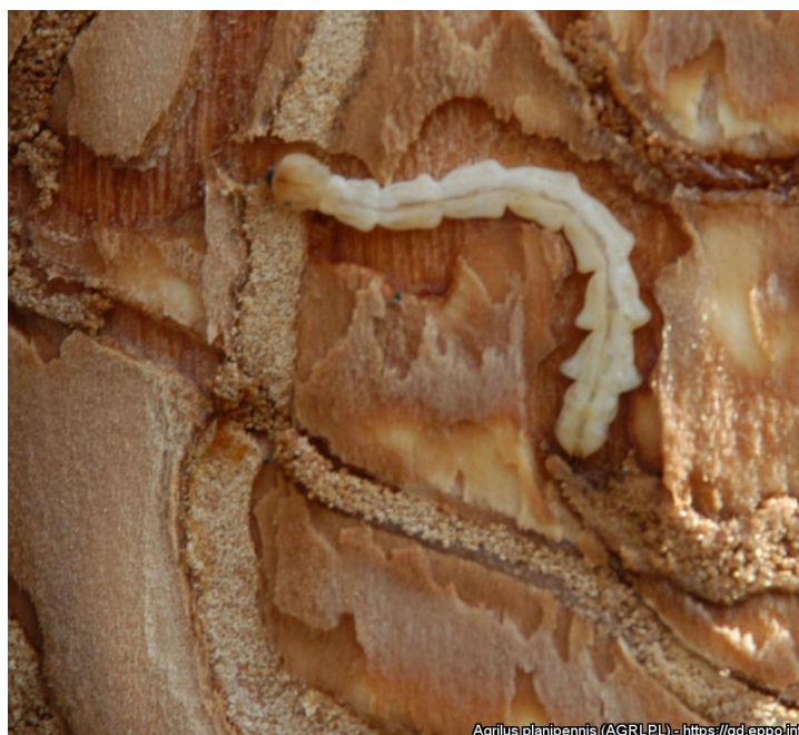
Fot. 3. Chrząszcz Agrilus planipennis

Agrilus planipennis (AGRLPL) - https://gd.eppo.int