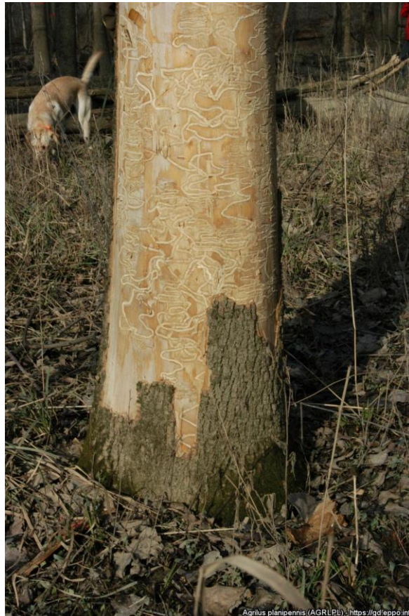
Fot. 1. Ślady żerowania Agrilus planipennis

Chrzążcze uszkadzają liście drzew. Larwy po wylęgu drążą długie serpentynowate korytarze w kambium i bielu, wypełnione brązowymi trocinami i odchodami (Fot. 1). Szerokość chodników ulega stopniowemu zwiększaniu wraz z rozwojem larw. W wyniku reakcji obronnej drzewa powstają pionowe pęknięcia chodników larwalnych, długości 5–10 mm. Na końcu chodnika larwalnego, tuż pod powierzchnią kory lub w wierzchnich warstwach drewna (jeżeli kora jest cienka), larwa wygryza komorę poczwarkową, w której zimuje, a wiosną ulega przepoczwarczeniu. Żerowiska larw A. planipennis nie są widoczne z zewnątrz, można je zaobserwować dopiero po zerwaniu fragmentu kory. Zasiedlenie drzew objawia się zamieraniem ich fragmentów, a następnie całych roślin. Dopiero po wydostaniu się spod kory nowego pokolenia chrząszczy, można na niej dostrzec charakterystyczne otwory wylotowe w kształcie litery “D” (Fot. 2). Istotnym jest, iż obecnie na terenie m.in. Polski jesiony wyniosłe zamierają z powodu choroby wywoływanej przez grzyb Hymenoscyphus fraxineus – objawy choroby i żerowania larw A. planipennis mogą być bardzo podobne. Pewność zasiedlenia drzewa przez larwy chrząszcza uzyskuje się dopiero po odnalezieniu żerowisk owada pod korą. Osłabione czynnikami chorobowymi drzewa są bardziej podatne na zasiedlenie przez owady, w tym A. planipennis .