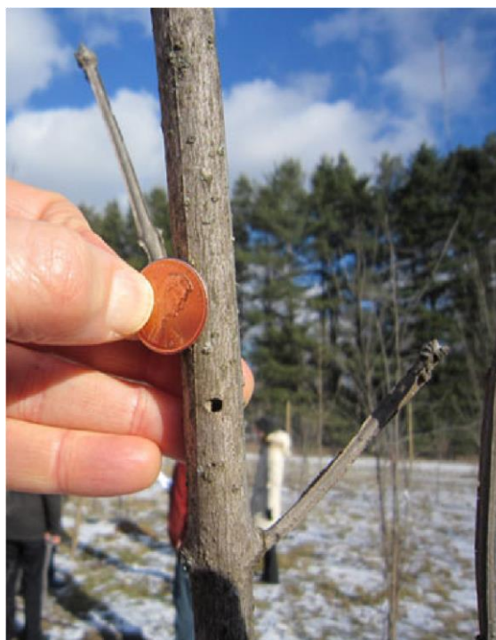
Fot. 2. Otwór wyjściowy chrząszcza A. planipennis w drzewku jesionu o średnicy pnia ok. 1 cm