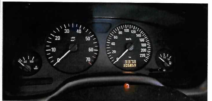
Astra II na dzień 23 (5)